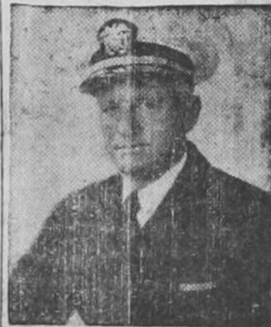
ALMIRANTE CHESTER W. NIMITZ Comandante de la Escuadra de los Estados Unidos en el Pacífico

que ha derrotado a la flota nipona frente a las Islas Filipinas