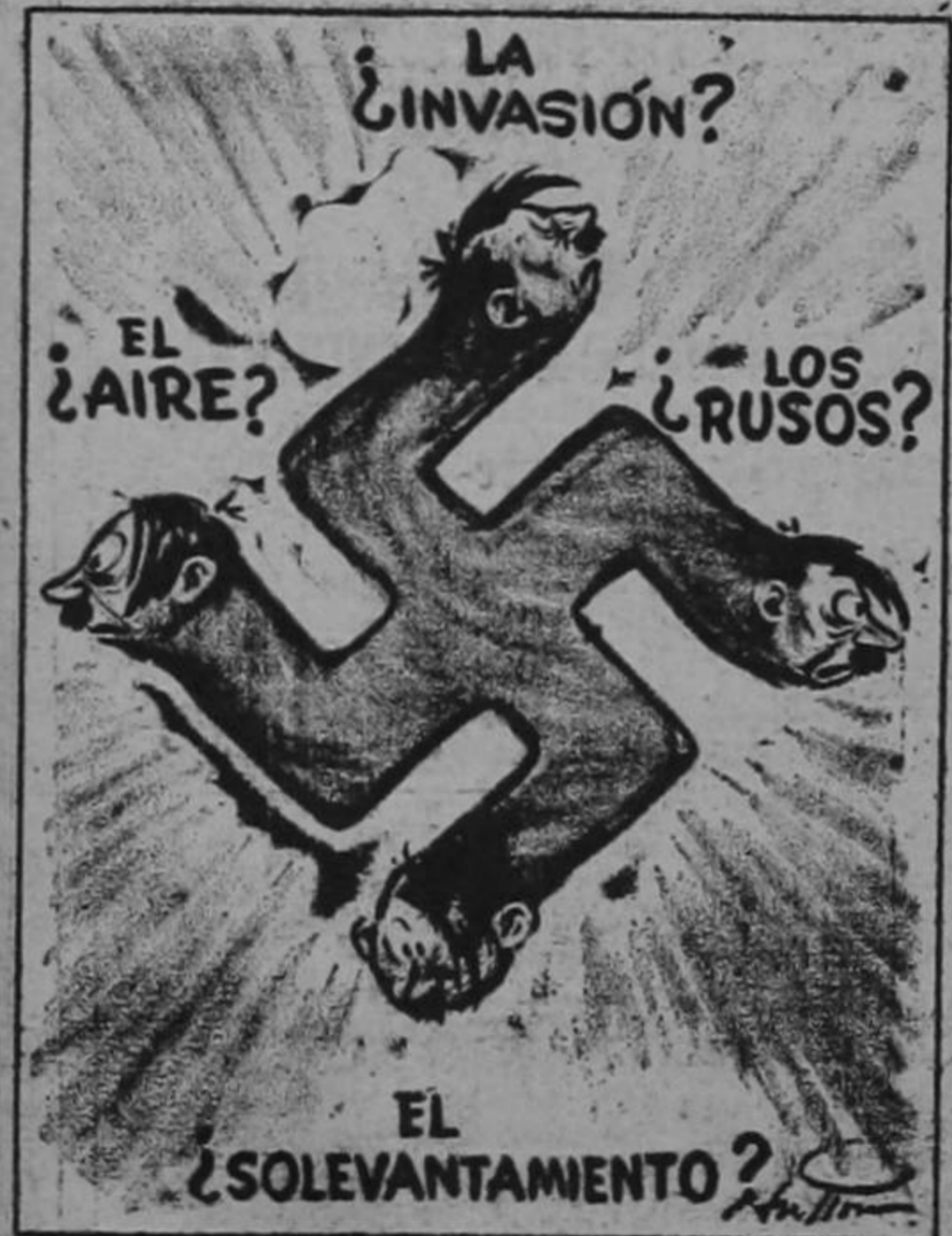
Muchos en el Philadelphia Inquirer.

Continúa enfermo de cuidados. ULTIMA HORA desea experimentar un cambio favorable en su organismo.