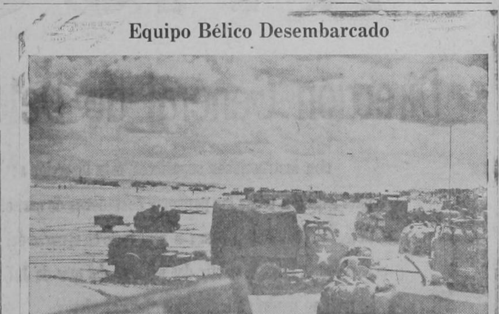
Equipo Bélico Desembarcado

dero un deber que este movimiento de contribución deb extenderse a todas las clases populares del país y que sustentan convencimiento democráticos; permitiéndome sugerir en el particular que debería pensarse ya, por medio de los respectivos y autorizados Comités; la creación de un medio práctico y modesto en