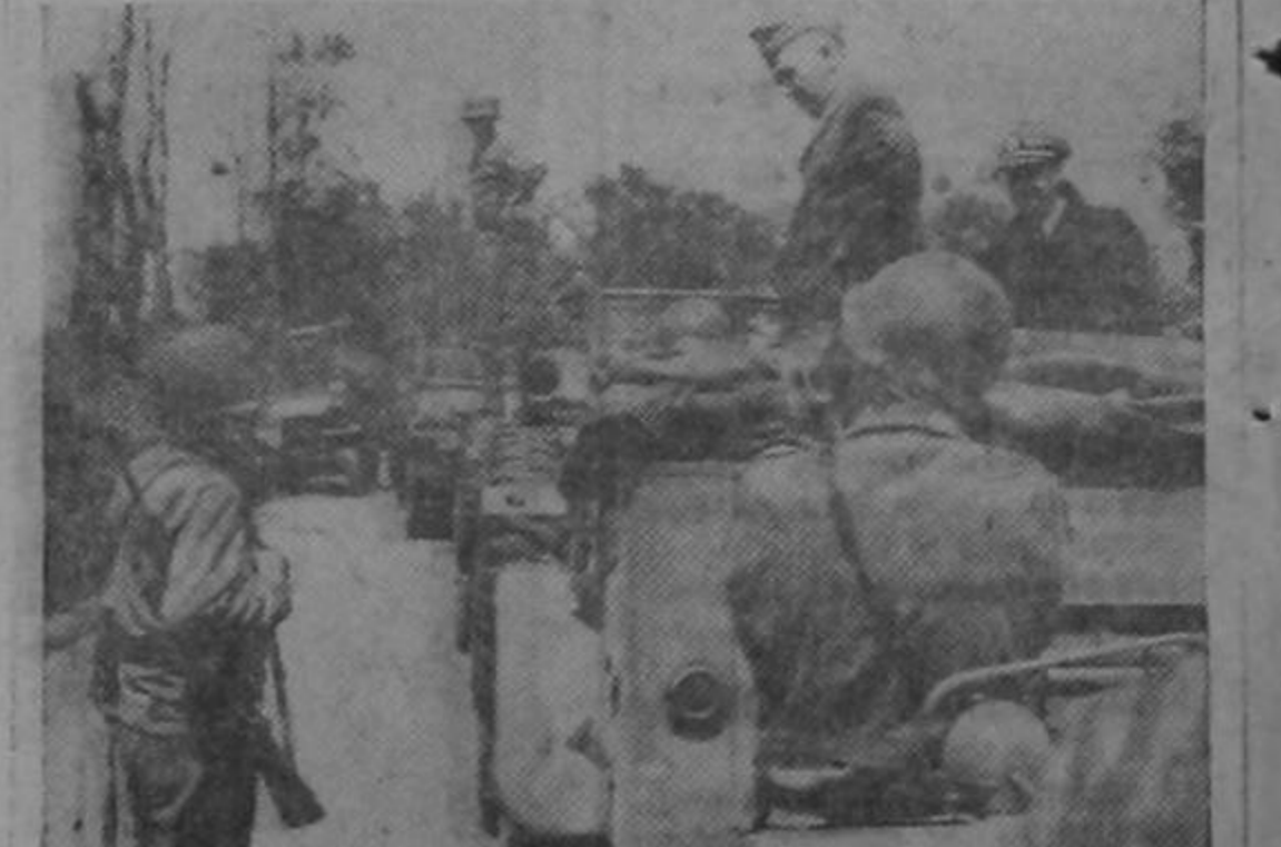
Aparece en esta fotografía el Gen. George C. Marshall, Jefe del Estado Mayor del Ejército de los Estados Unidos, en una carretera de Francia donde se detuvo para platicar con un soldado de infantería. El general Marshall visitó Normandía una semana después de que las tropas aliadas asaltaron las defensas costeras de los nazis. Esta fotografía fué radiada desde Londres a Washington.