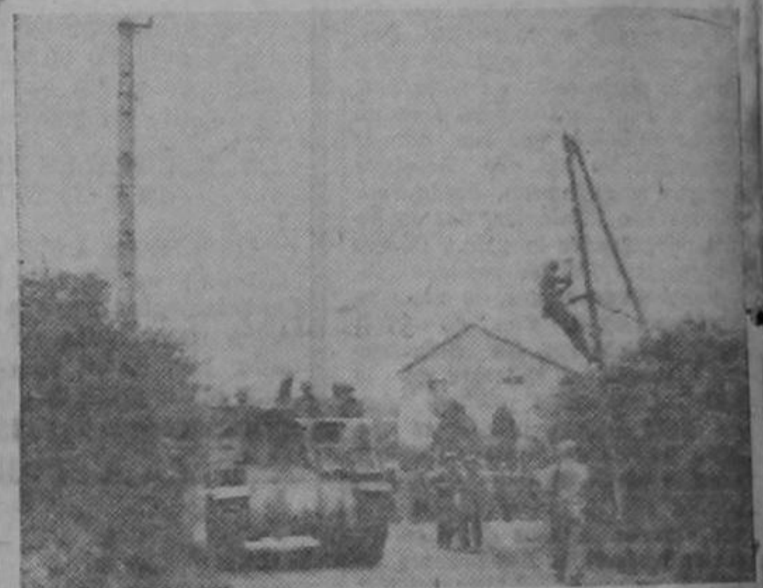
Mientras los electricistas del cuerpo de señales reparan las líneas de comunicaciones, los tanques del Ejército de los Estados Unidos avanzan en una carretera de Normandía. Esta fotografía fué transmitida por radio desde Londres a Washington.