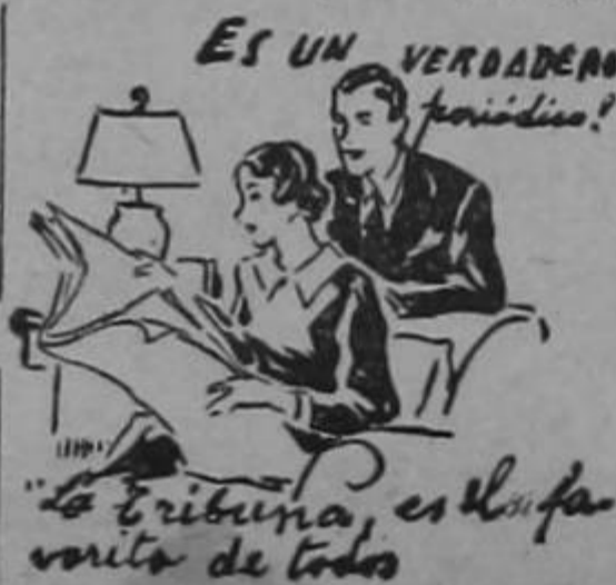
ES UN VERDADERO PARADISO! "La Tribuna, es la favorita de todos"