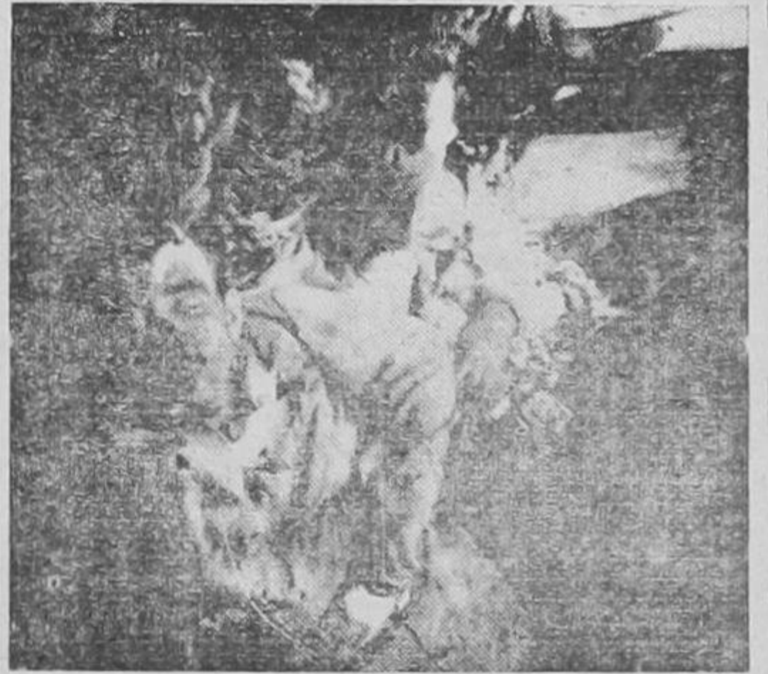
COMO QUEDARON LAS VICTIMAS