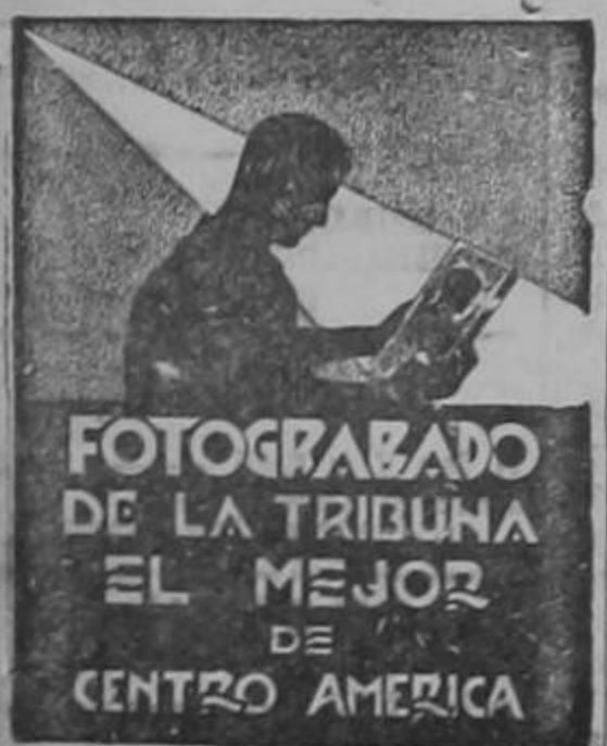
FOTOGRAFADO DE LA TRIBUNA EL MEJOR DE CENTRO AMERICA