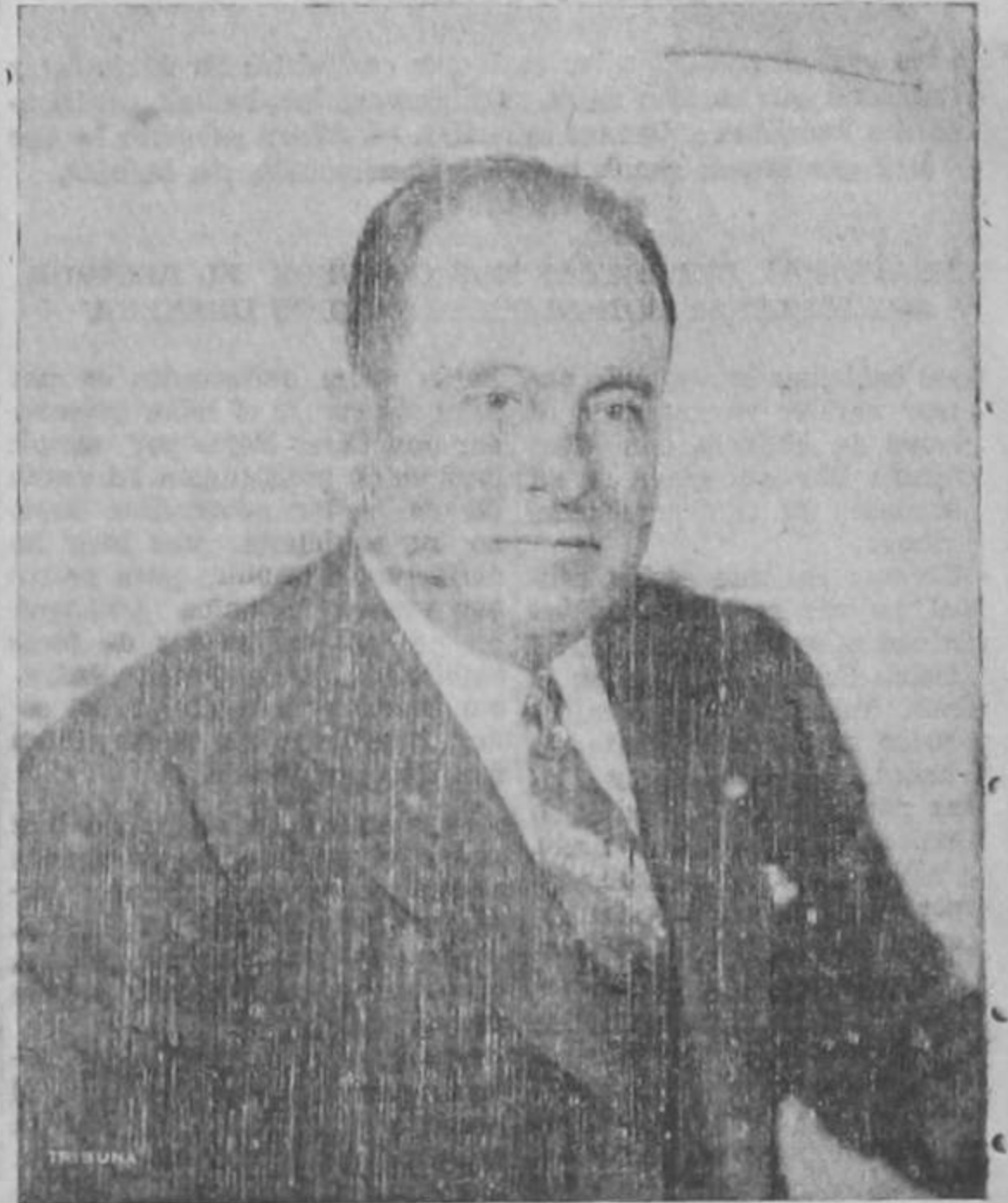
General Anastasio Somoza,