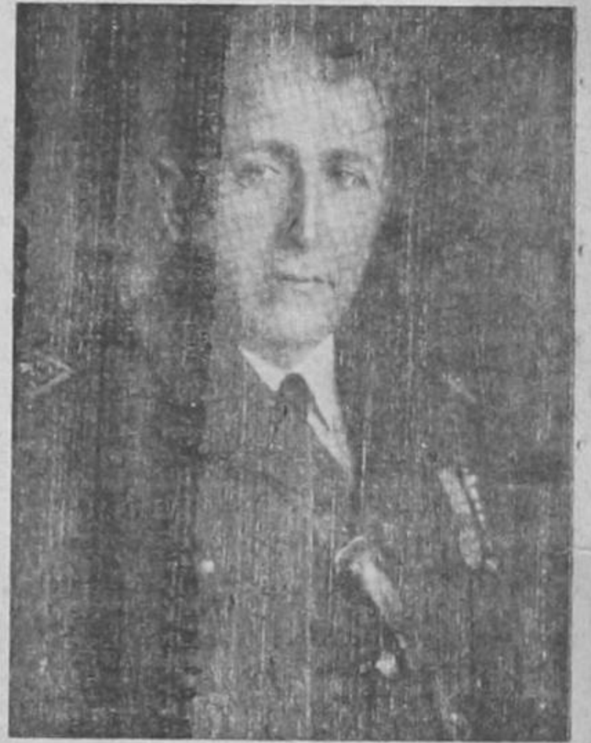
General JORGE UBICO