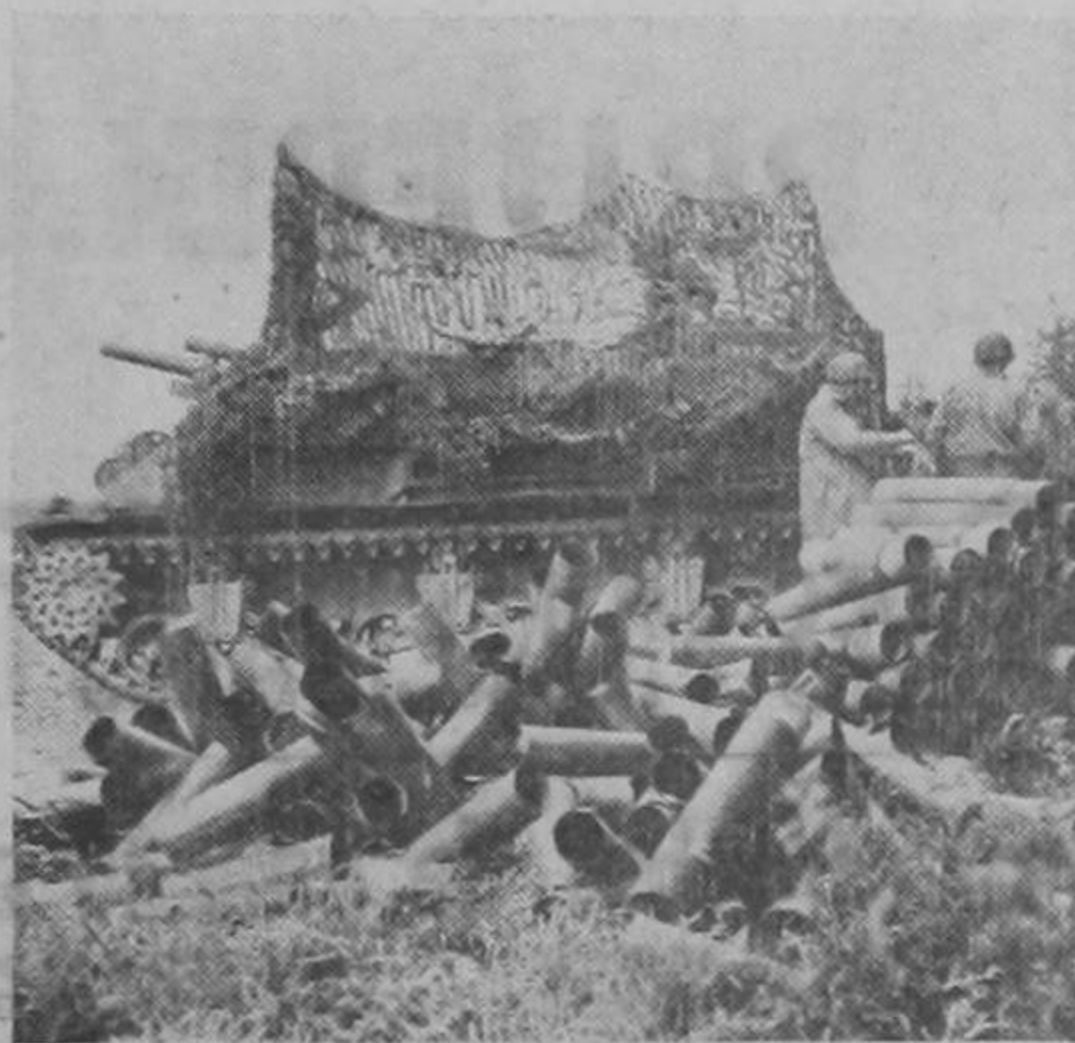
Cañón motorizado del Ejército de los Estados Unidos en Normandía a punto de iniciar el avance del día después de una noche de nutrido fuego contra las posiciones nazis. El montón de casquillos que aparece a un lado del cañón es una muestra patente de la intensidad del fuego.