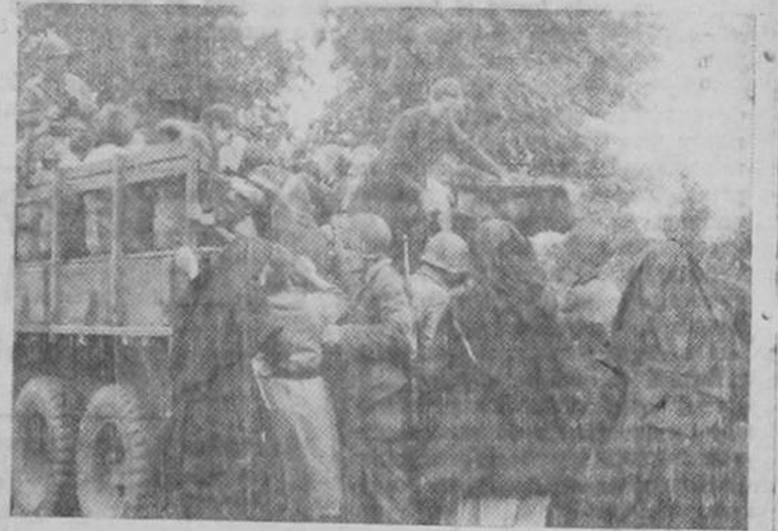
Soldados de los Estados Unidos trasladan en Normandía a las monjas y aldeanas de una región amenazada por el fuego de la artillería alemana.