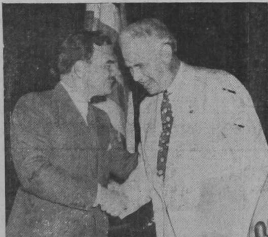
Thomas E. Dewey (izquierda), gobernador del estado de Nueva York, y John W. Bricker, gobernador del estado de Ohio, nominados en Chicago por el Partido Republicano como candidatos a la presidencia y vicepresidencia de la nación, respectivamente, en las elecciones que tendrán lugar el próximo mes de noviembre.

De Estocolmo se anuncia que los alemanes tienen una bomba tremenda que podrá ser lanzada desde Alemania hasta Nueva York