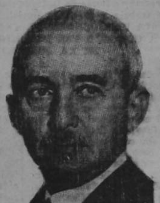
ISMET INONU, Presidente de Turquía, a quien su pueblo quiere obligar a enfilar a su país entre las Naciones Unidas en guerra contra el Eje.