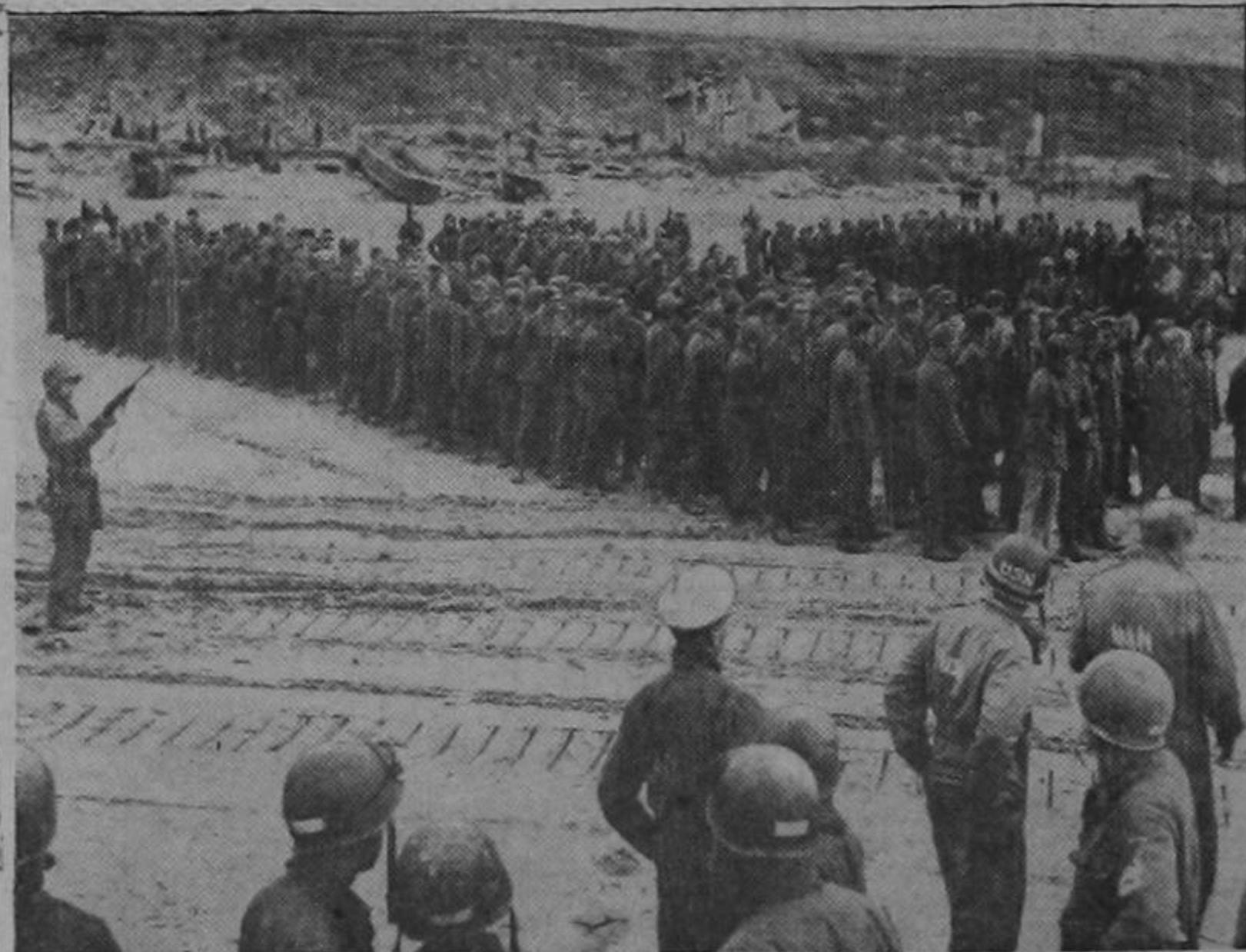
Largas columnas de prisioneros alemanes esperan en las playas de Normandía los transportes que los trasladarán a los campamentos de Inglaterra. Vigilados por la policía militar de los Estados Unidos, los prisioneros son objeto de la curiosidad de los marinos.