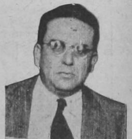
DON JOSE J. PERALTA, ministro de agricultura, que habla en nuestra página 3 sobre el plan oficial para que haya más