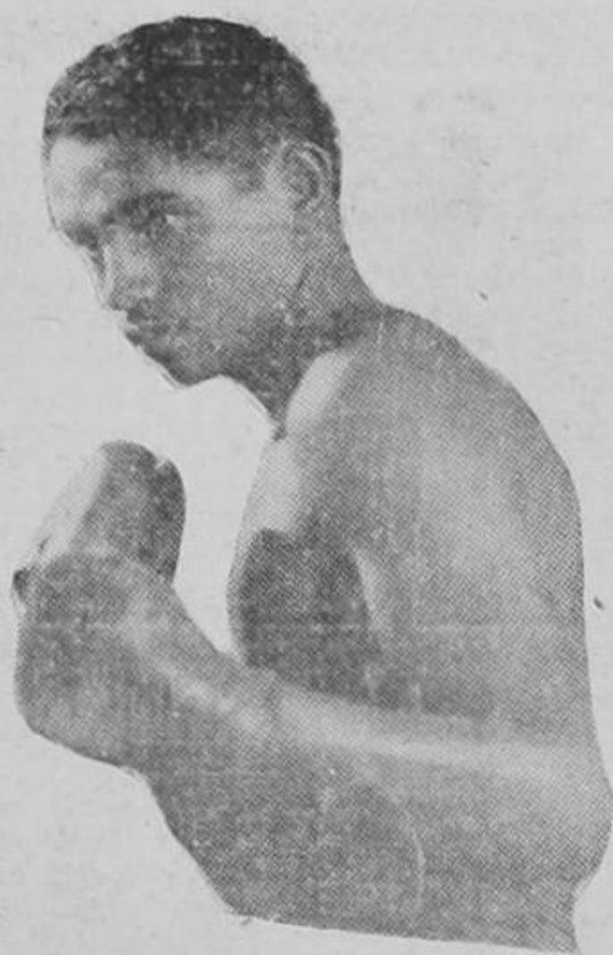
Las localidades están a la venta en La Magnolia, el Centro de Sport, Casa New York, Tienda Carlos Luis y Barbería de los Hermanos Bonilla, Teléfono 5546.