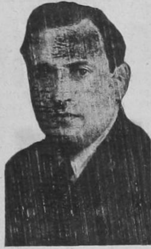
Dr. CALDERON GARDIA