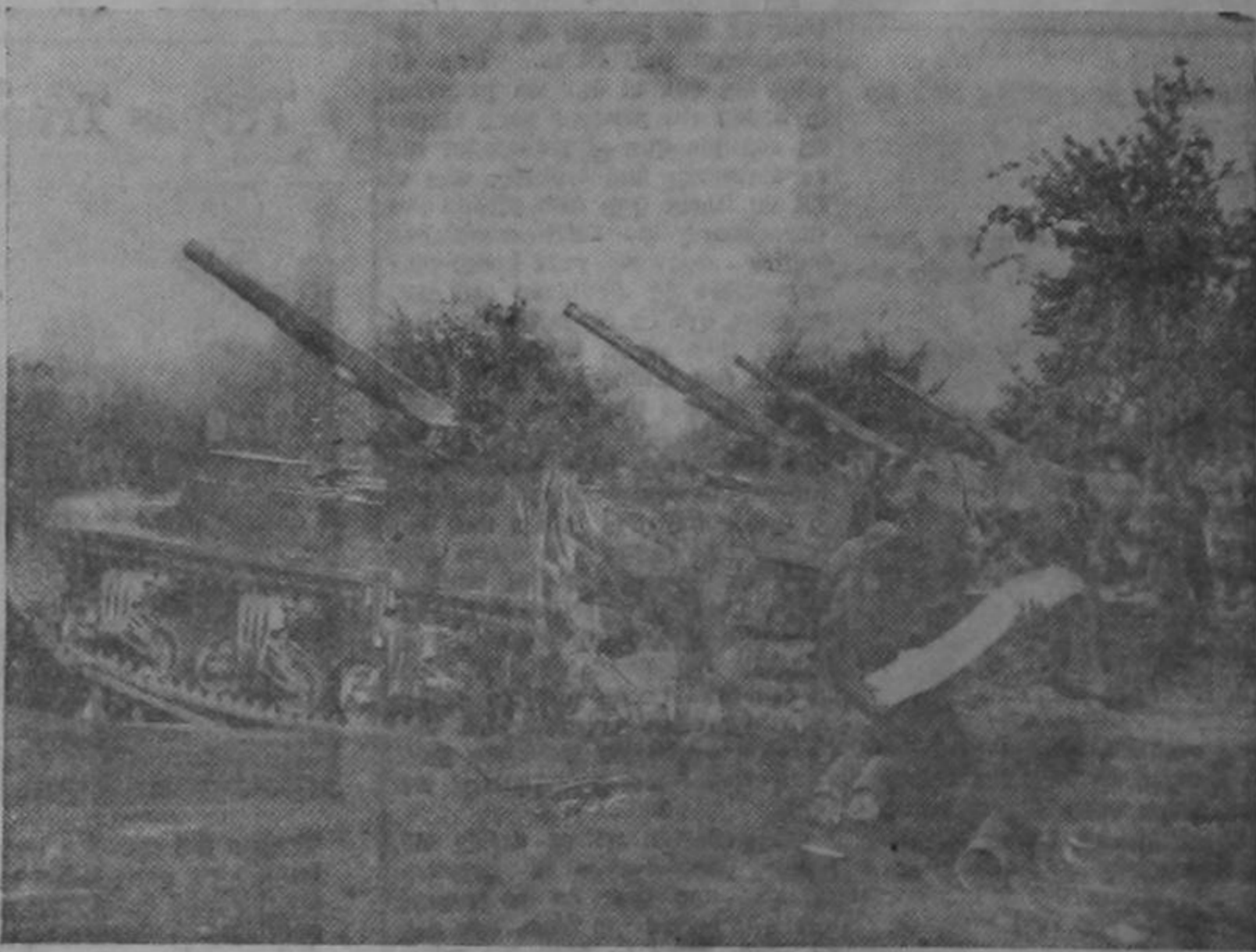
Una batería norteamericana de artillería móvil, calibre 155, dispara contra las defensas de la línea Sigfrido, cerca de Aquisgrán. La mortífera concentración del fuego de artillería, sumado a los ataques de la aviación, bien pronto abrieron las brechas en las tan ponderadas defensas alemanas, por donde penetraron la infantería y tanques.