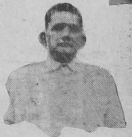
General Noguera Gómez, jefe de los nicaragüenses que se alzaron en revuelta dentro de territorio costarricense contra el gobierno del general Somoza.

Al entrar hoy las fuerzas del gobierno en el lugar donde los nicas se habían hecho fuertes. Muelle de San Carlos, éstos últimos huyeron a la desbandada. Dejó el general Noguera Gómez abandonados su valija y su sombrero, y además, gran cantidad de parque y armamento pesado.