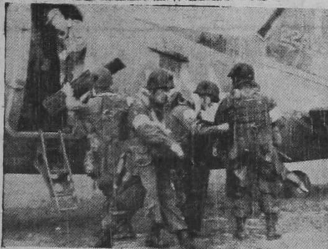
Tropas del ejército estadounidense de paracaidistas entrando en aeroplanos en Inglaterra que los conducirán a sus blancos detrás de las líneas nazis. Millares de estos soldados descendieron en Holanda para cortar las líneas de defensa alemanas. Su ataque coincidió con fuertes embestidas lanzadas por las fuerzas regulares terrestres con el objeto de hacer contacto con las primeras para unir sus posiciones. (Fotografía enviada por radio a Washington desde Londres.)