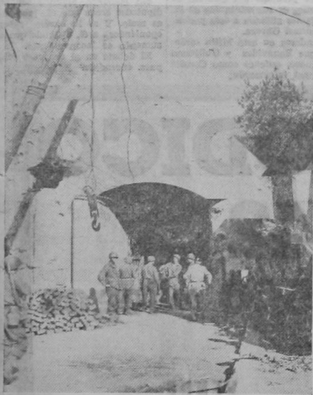
En 1940 los alemanes anunciaron ruidosamente al mundo la toma del fuerte belga de Eban-Emael dando a entender que habían empleado armas secretas y nuevos métodos de guerra. En 1944 un solo batallón de los Estados Unidos arrebató el mismo fuerte a los nazis en operación corriente. En esta foto soldados estadounidenses examinan el "inexpugnable" baluarte.