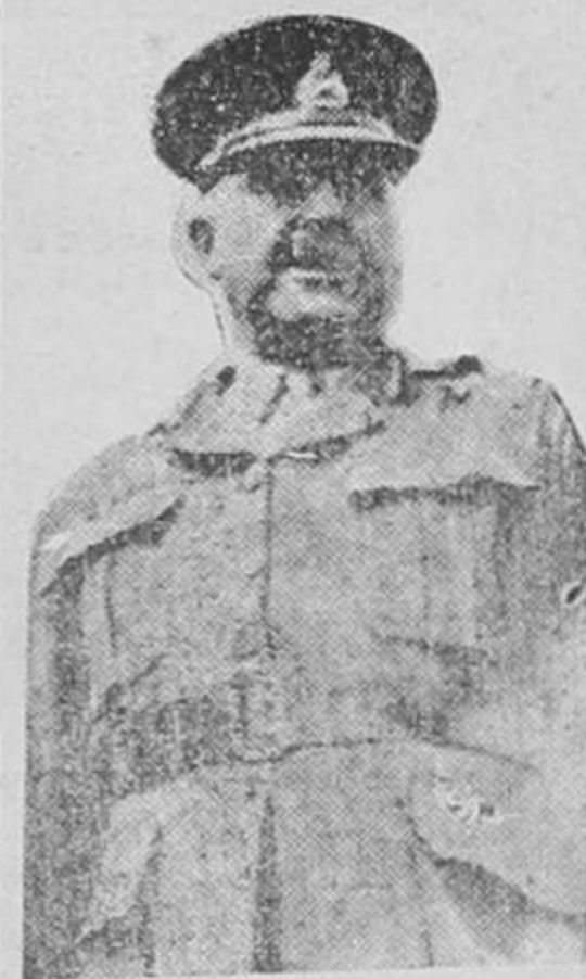
General Maitland Wilson, con quien se entrevistarán hoy delegados húngaros en la ciudad del Vaticano, a fin de pedirle los términos de un armisticio. Hungría busca afanosamente una salida del atolladero.

LOS AMERICANOS INFORMAN QUE HAN SIDO HUNDIDOS 232 BARCOS Y DESTRUIDOS CENTENARES DE AVIONES.— EL CUARTEL GENERAL JAPONES ANUNCIA QUE LA BATALLA AEREA SOBRE FORMOSA CONTINUA TODAVIA HOY SABADO CON UNA FURIA INSITUADA. LOS NIPONES HABLAN DE SERIAS PERDIDAS PARA LOS NORTEAMERICANOS.— ESTA BATALLA COMENZO ANOCHE CON UN BOMBARDEO CONCENTRADO DE LAS SUPERFORTALEZAS B-29