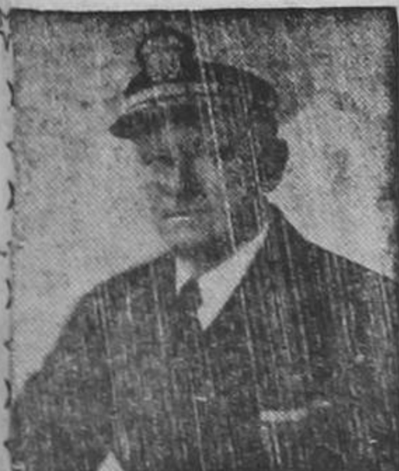
ALMIRANTE CHESTER W. NIMITZ

Comandante de la Flota de los Estados Unidos en el Pacífico