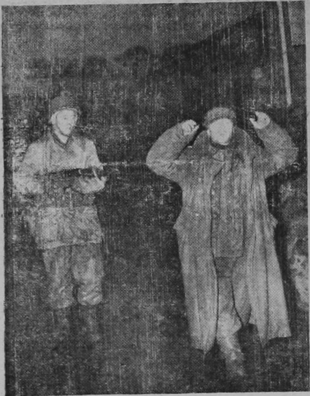
Un soldado norteamericano custodia a un descorazonado nazi capturado en la retaguardia durante la ofensiva dentro de Alemania. El abatido superhombre era miembro de la división "Crespúsculo de los Dioses."

A QUIEN PRESENTE A LA ADMINISTRACION "NA" EL CH. N.º 2902, EXTENDIDO A LA ORDEN ANGLO COSTARRICENSE, POR LA SUMA DE POR LOS SEÑORES LYON HNOS., SOC. AN. TRAVIADO EN LA MAÑANA DE HOY.