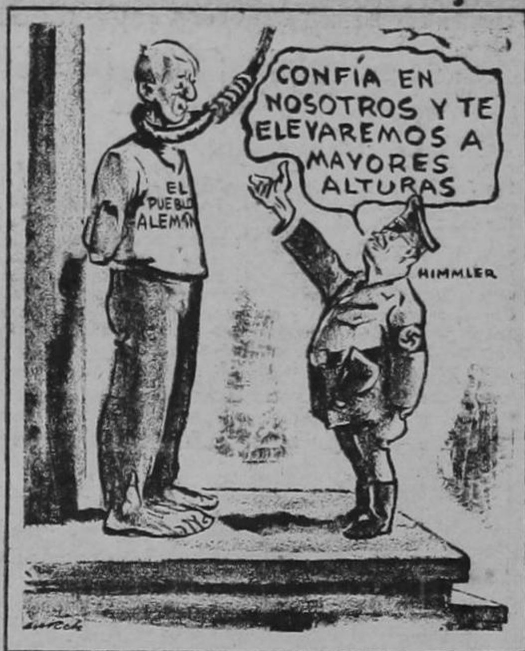
Burck en el Chicago Times.