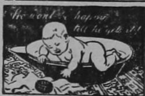
Parte de un cuadro grande que fué uno de los anuncios mejor conocidos del Jabón Pears.