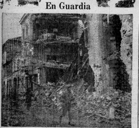
Soldados estadounidenses patrullan las calles del pueblo alemán de Linnich, en busca de posibles francotiradores enemigos.