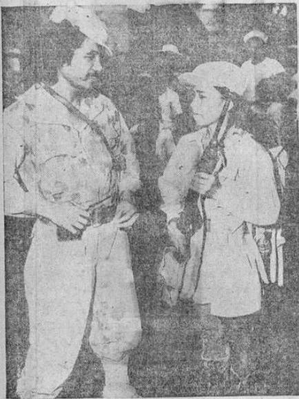
El Tte. Engracia Díaz, jefe del ejército patriota filipino en la isla de Leyte, con su ayudante, Mateo Dedil, de 16 años. Desde 1942, hasta que trajo sus fuerzas al cuartel general de MacArthur, el Tte. Díaz ha combatido constantemente contra los japoneses.