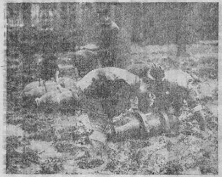
Azotados por las tempestades y atacándose en el lodo del frente occidental, soldados de los Estados Unidos transportan poderosas bombas hasta los aeródromos para cargarlos en los aeroplanos que a diario bombardean los centros industriales y las líneas de comunicaciones alemanas.