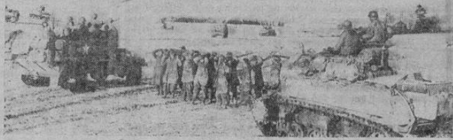
Un tanque ligero del ejército de los Estados Unidos se sale de la línea de ataque para vigilar un grupo de prisioneros alemanes que se rindieron en el frente occidental. Los otros tanques de la columna continúan su avance hasta el punto de ataque.