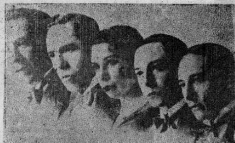
LOS HERMANOS ATAYDE

PRECIOS DE LAS LOCALIDADES (Incluso los impuestos):