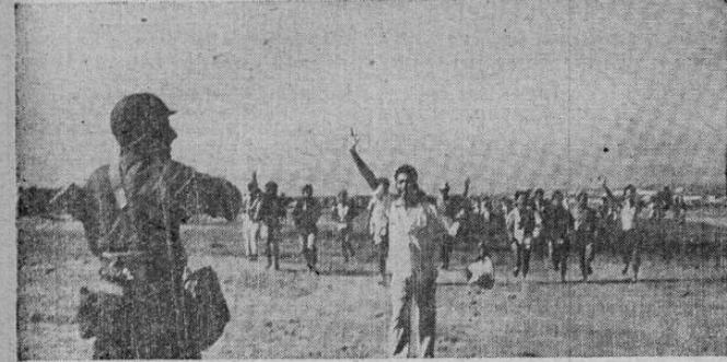
Sin cuidarse de las bañas japonesas, estos filipinos llenos de júbilo acuden al encuentro de las tropas norteamericanas que acaban de desembarcar en Luzón. Una ofensiva poderosa de esas tropas las llevó bien pronto a Manila.

Examinados estos productos por el Químico Oficial, doctor Adrián Chaverri, en el laboratorio de la Fábrica Nacional de Licores, se comprobó que el grado de acidez volátil que posean, es muy alta. A tal punto llega este grado que el vino de nispero, por ejemplo, lo determina fuera del límite establecido por el Reglamento de Alimentos y Bebidas vigente que tolera como límite 2,5 grados de acidez volátil y el vino citado presenta casi el doble de ese valor.