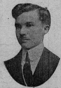
Doctor SOLON NUÑEZ