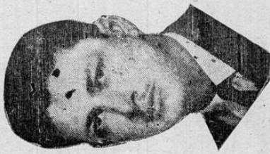
Señor Secretario de Gobernación, licenciado don FERNANDO SOTO HARRISON.

El señor secretario de gobernación licenciado don Fernando Soto Harrison, de acuerdo con el señor presidente de la república licenciado don Teodoro Picado, encargó a una comisión integrada por el presidente de la corte suprema de justicia licenciado don Víctor Guardia Quiros, por el magistrado don José María Vargas y por el secretario de la corte licenciado don Alfredo Zúñiga Pagés la redacción de un proyecto de Ley Orgánica del Registro Civil. Esa comisión completó su trabajo y sometió el proyecto respectivo al señor secretario de gobernación licenciado don Fernando Soto Harrison con una amplia exposición cuyo texto ofrecemos y que es la siguiente: