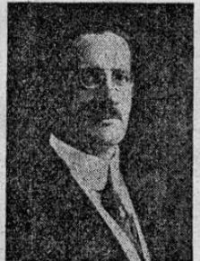
Don RICARDO ALFARO

AYER LE FUE OFRECIDO EN WASHINGTON UN BANQUETE POR EL DIRECTOR GENERAL DE LA U.N.R.R.A., Mr. HERBERT LEHMANN