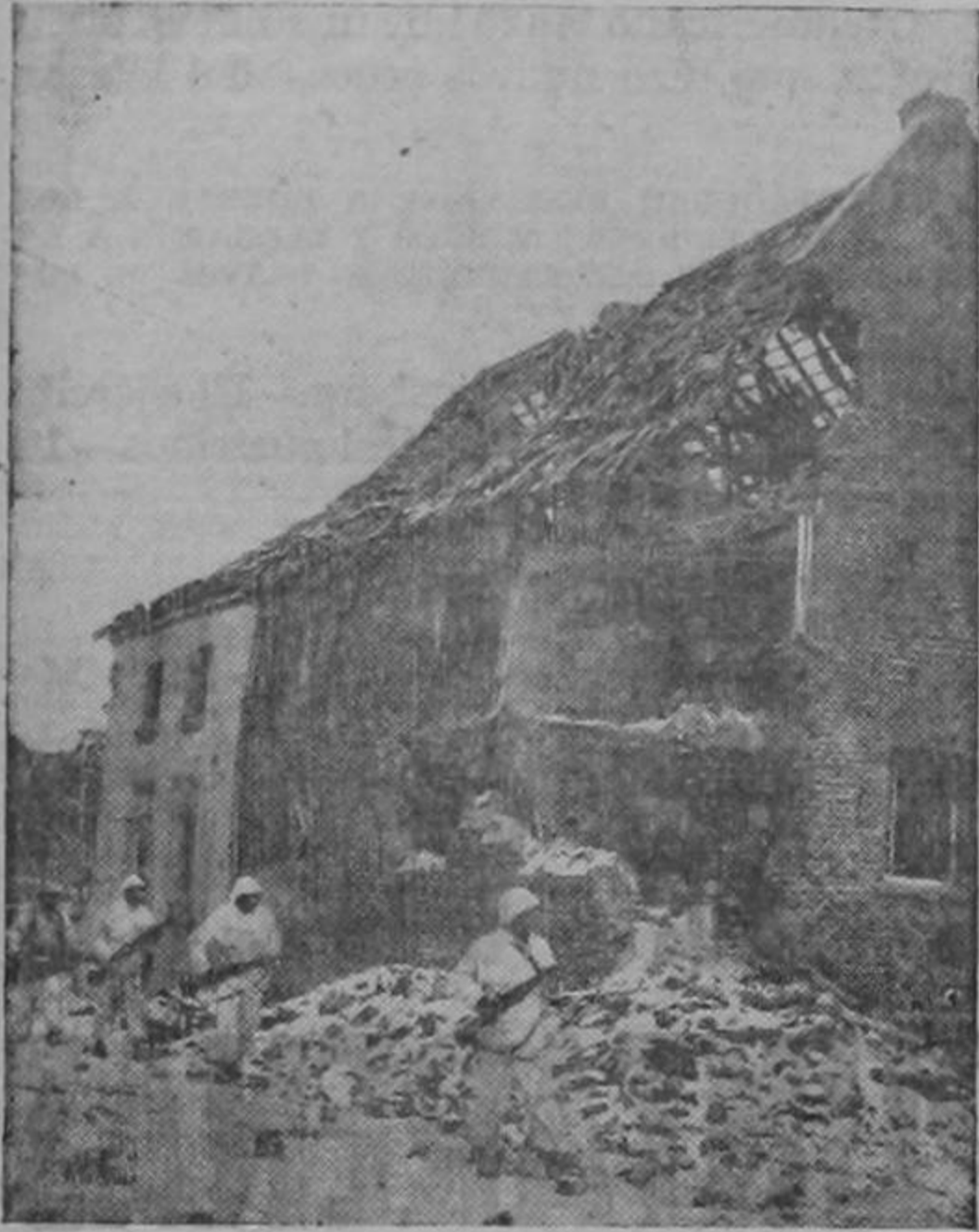
Tropas mimetizadas estadounidenses que toman parte en la campaña de destrucción de la línea Sigfrido avanzan por las calles de la destrozada ciudad de Brachelen, penetrando más profundamente en territorio alemán.