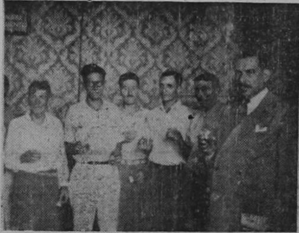
El señor Presidente de la República brinda con un grupo de agricultores por el feliz acontecimiento.

"Los aplausos que estáis oyendo, señor Presidente, salen del corazón del pueblo que se da cuenta de que estáis cumpliendo las promesas de ayer. El hecho de incorporar a la producción centenares de tierras incultas mediante una política agraria bien equilibrada es la mejor forma de capacitar a nuestro país para las grandes batallas contra la miseria. La libertad necesita fundamento económico para que sea libertad; y es en la tierra donde debe buscarse la base de la verdadera libertad. Bienvenido, señor Presidente. Estáis en nuestro corazón y especialmente en el corazón del pueblo trabajador".