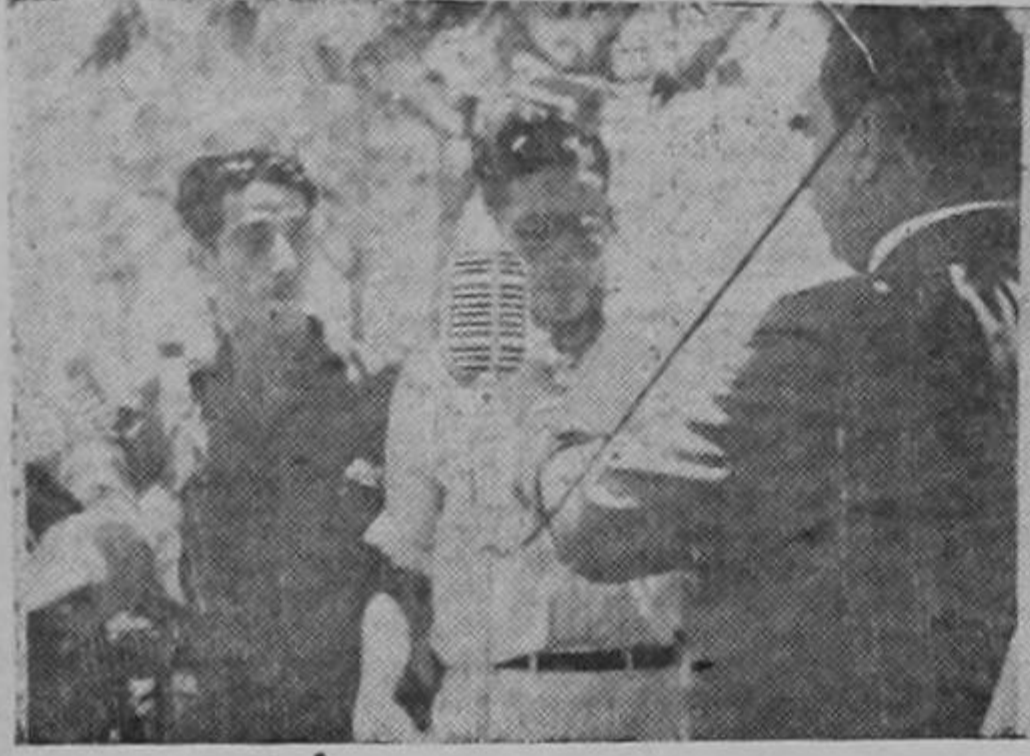
El señor Presidente de la República, licenciado don Teodoro Picado, hace entrega del título de posesión de las tierras al presidente de la Unión Campesina.

El mes de abril es un mes favorable al destino de Costa Rica: en el '56, el pueblo con Juan Santamaría a la cabeza, asedió una derrota al filibusterismo invasor; en 1945 el pueblo de Costa Rica con las organizaciones campesinas al frente, lleva a cabo una campaña de ver a la esposa del Presidente de la República a la par de su memorable de repartición de tierras en diferentes lugares del país para combatir al hambre y a la reacción, tan inescrupulosas e inhumanas como los bucaneros de 1856. Se han dado batallas contra estos enemigos durante el mes de abril de 1945 en la Uruca, en Cot, en Parrita y el pasado domingo en Barba.