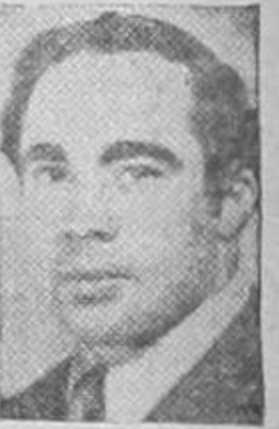
Robert S. Musel

UNA DE LAS BATALLAS MAS SANGRIENTAS DE LA GUERRA SE LIBRA EN LAS CALLES CENTRALES DE BERLIN, CUBIERTAS DE ESCOMBROS Y RUINAS HUMEANTES, PUES LOS BATALLONES DE ASALTO DE ZHUKOV Y KONEV CONVERGEN SOBRE LA AVENIDA UNTER DER LINDEN POR EL NORTE Y POR EL SUR. — ENTRE TANTO, LA TERCERA COLUMNA EMBISTE POR EL BULEVAR FRANKFURTER DESDE EL ESTE Y SE HALLA CERCA DE ALEXANDER PLATZ.