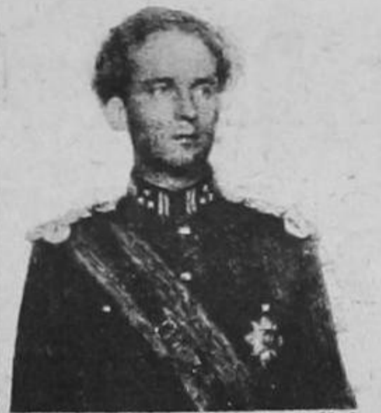
El Rey Leopoldo de Bélgica, respecto de cuya suerte no se volvió a saber más, se encuentra libre, con toda su familia, en Suiza