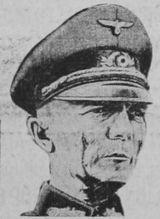
Mariscal de Campo Fedor von Bock, cuyo cadáver fue encontrado por los aliados en un sitio aun no especificado. Von Bock fue el hombre que dirigió la invasión a Rusia. Ahora le tocó su turno. Es uno menos.