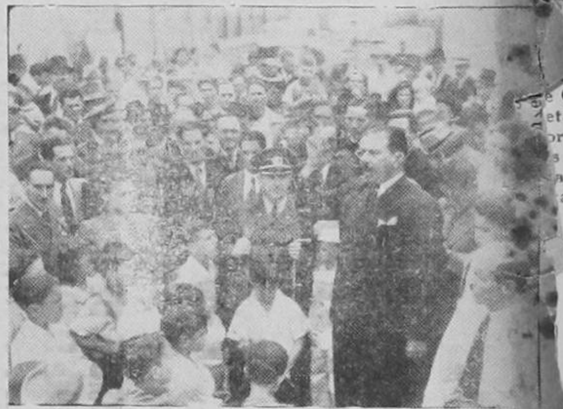
Momentos en que el señor Presidente Picado pronuncia su discurso al inaugurar la nueva cañería de Tibás.