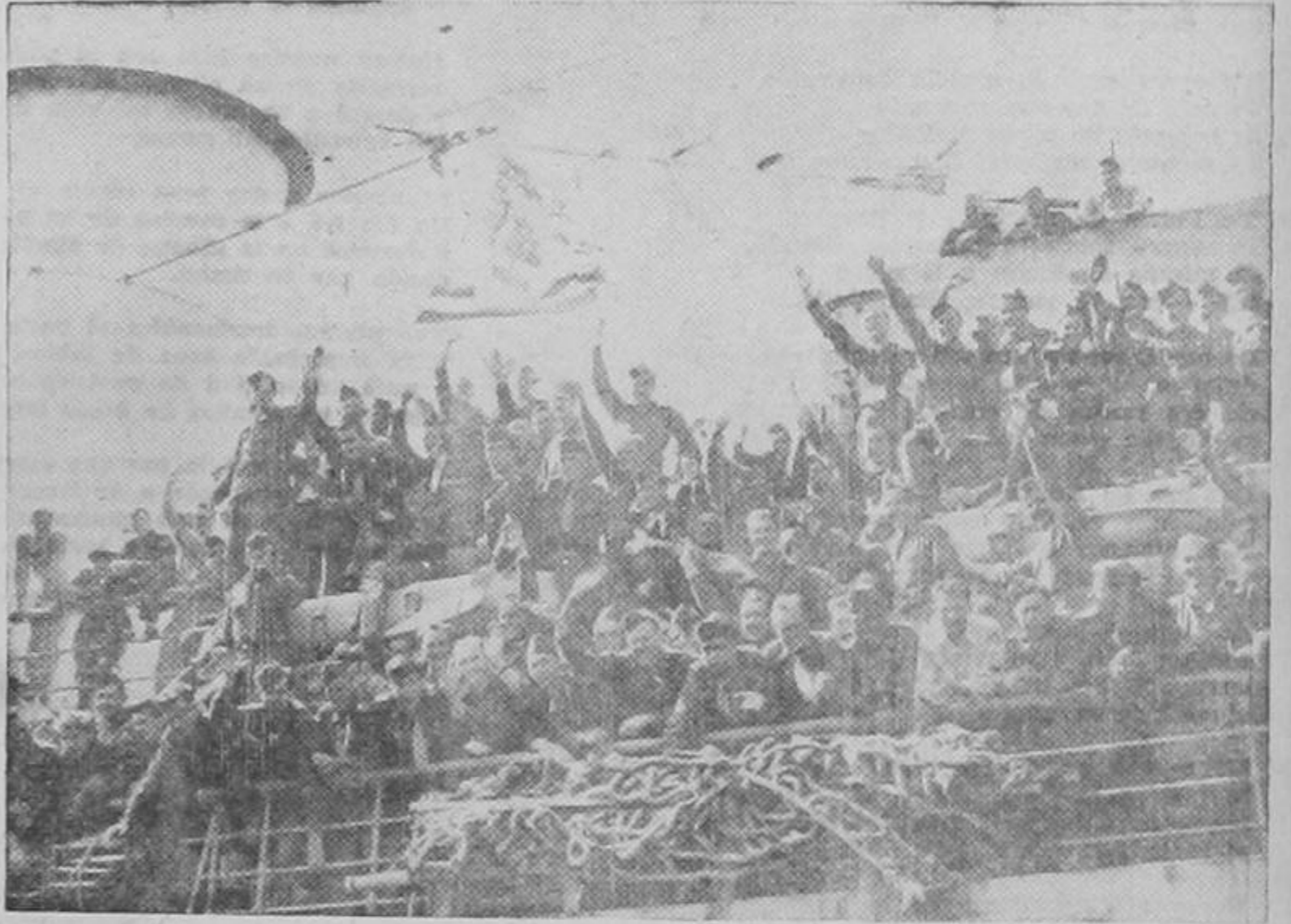
Soldados de los Estados Unidos que retornan de Europa se apiñan sobre la barandilla cuando el transporte atraca en Nueva York. En su mayoría son heridos o prisioneros rescatados de los campamentos de concentración del Eje. Algunos gozarán de una corta licencia mientras se preparan para su traslado al Pacífico.