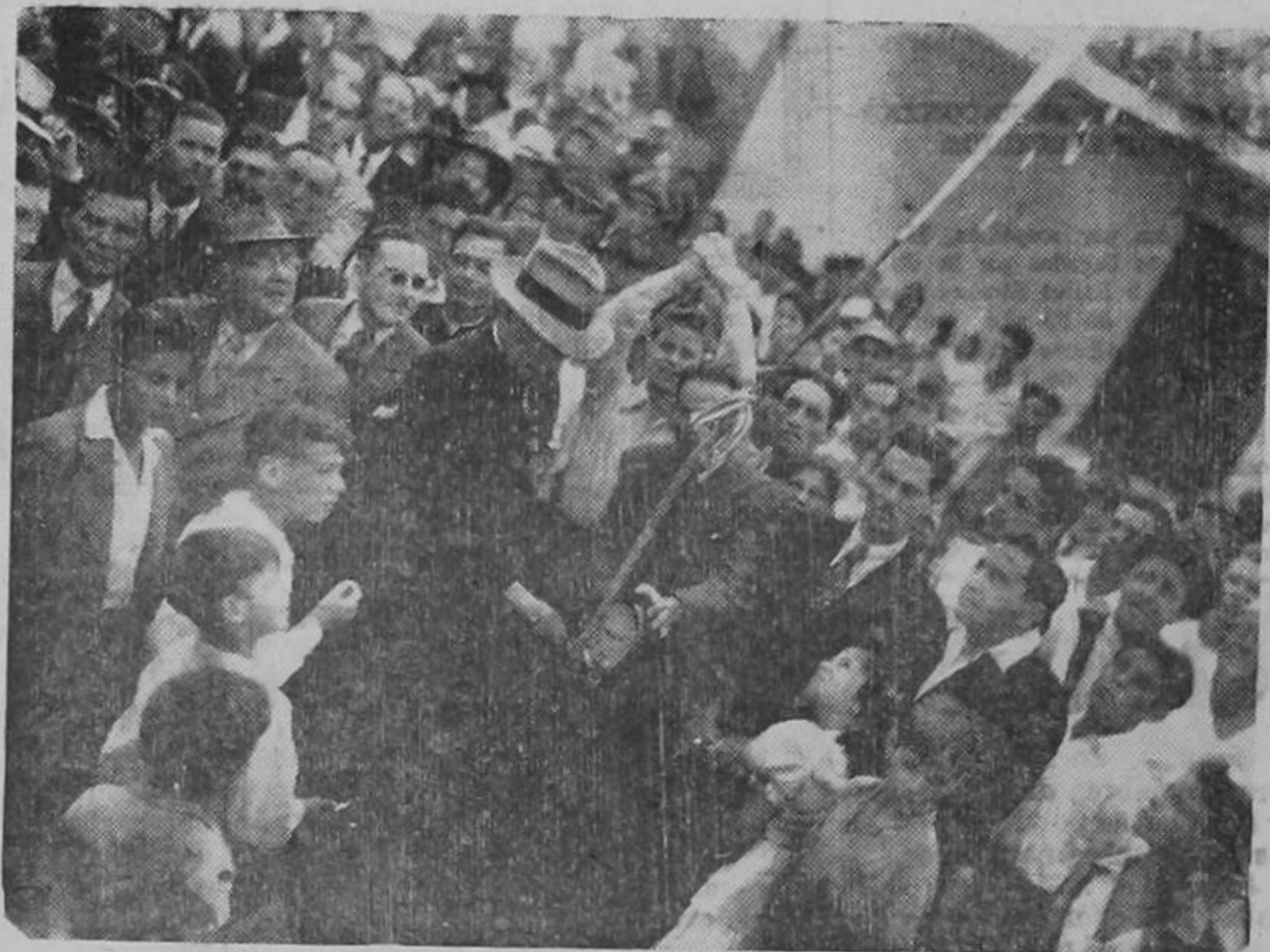
El señor Presidente de la República, rodeado de una multitud, abre la llave de la nueva cañería de Tibás, que desde el domingo comenzó a prestar sus servicios.