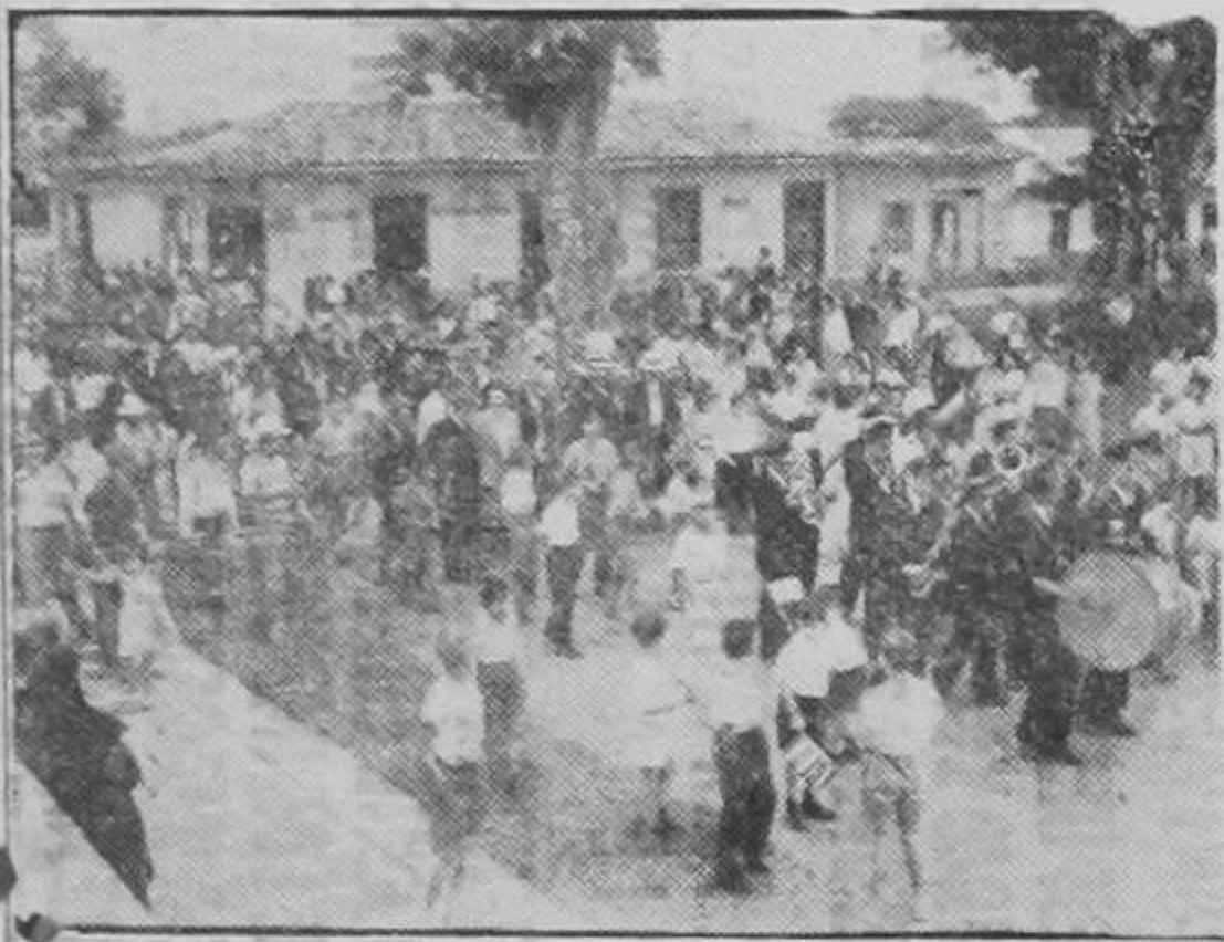
Llega a la ciudad de Tibás el señor Presidente de la República, siendo objeto de una entusiasta demostración de simpatía del pueblo de ese cantón.

HABLARON IMPORTANTES VECINOS DEL CANTON Y OTRAS PERSONAS RESALTANDO LA IMPORTANCIA DE ESTA CAÑERIA, LA MAS IMPORTANTE DESPUES DE LA DE PUNTARENAS.— EL SR. PRESIDENTE PICADO FUE OBJETO DE UN ENTUSIASTA RECIBIMIENTO Y DE DIVERSOS HOMENAJES EN SU HONOR COMO DEMOSTRACION DE SIMPATIA DEL PUEBLO DE TIBAS