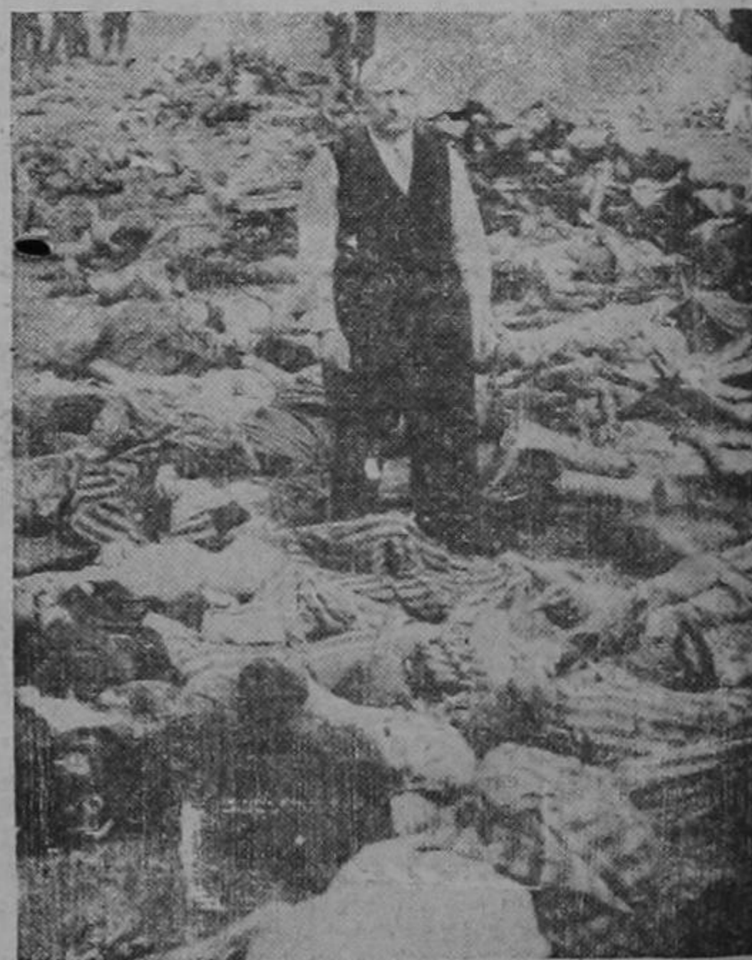
El comandante del campamento de concentración nazi de Landsberg, cercano a Munich, fotografiado en medio de algunas de sus víctimas, quemadas vivas o asesinadas al aproximarse las fuerzas de los Estados Unidos al campamento. Al igual que muchos otros campamentos, este presentó escenas de horror que no tienen paralelo en los tiempos modernos.