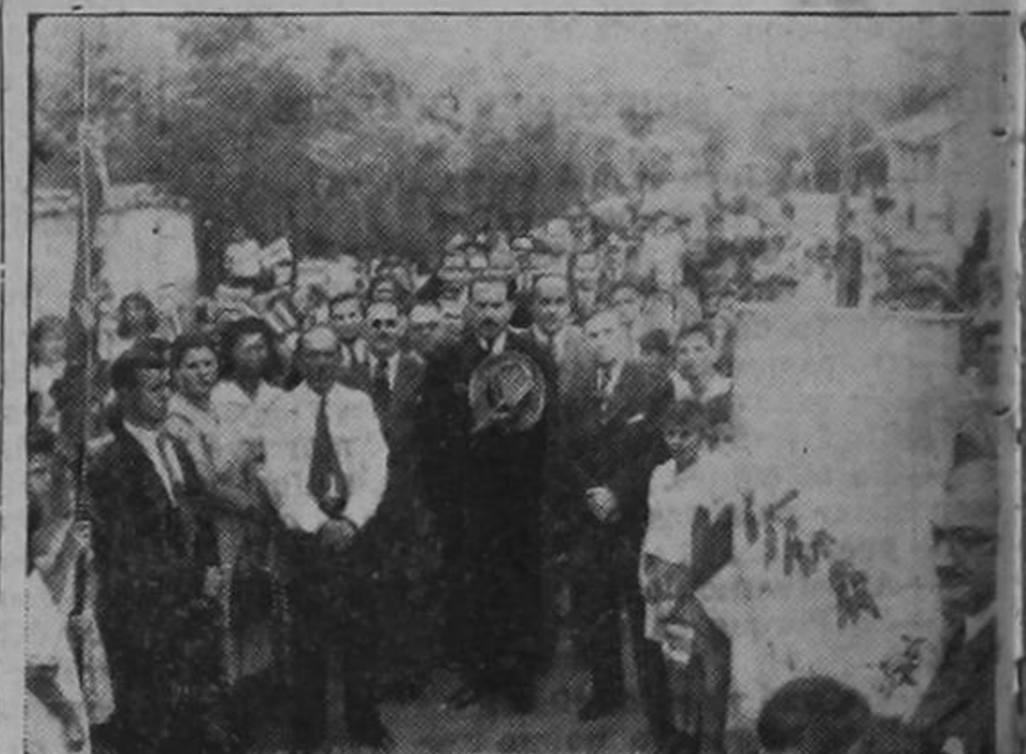
Diversos aspectos de la inauguración el domingo, de la nueva cañería de Tibás.

todo las dificultades económicas. Pero el Sr. Presidente Picado sabía que Tibás necesitaba agua y se empeñó en que el problema se resolviera. Y al hacer historia de esta cañería es preciso recordar fechas y recordar hombres. Fué a los inicios de la administración González Víquez—cuando el pueblo de Tibás tenía que surtir de agua tomada de un pozo—cuando un gobierno no se interesó por dotar al cantón de un servicio de cañería. No pudo don Cal-