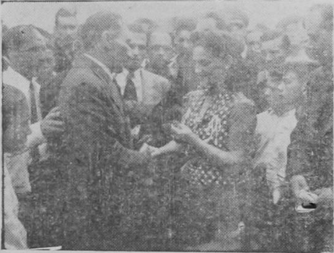
Otro aspecto del magnifico recibimiento que se le hizo en Tibás al señor Presidente de la República, licenciado don Teodoro Picado.