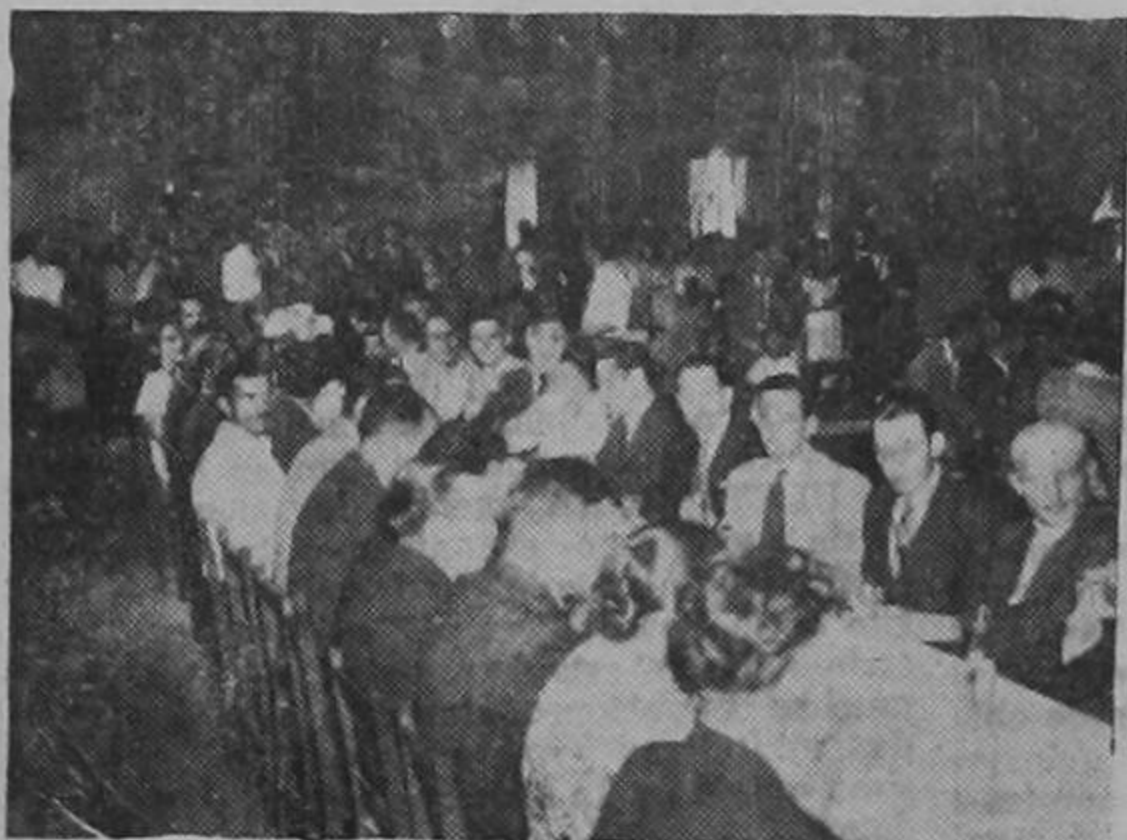
Un aspecto del homenaje al señor Presidente de la República después del acto de inauguración de la nueva cañería.