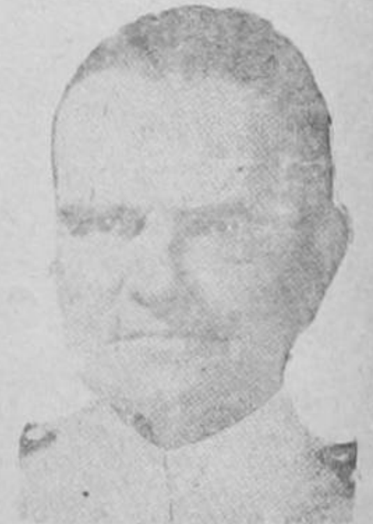
ALMIRANTE HALSEY Comandante de la tercera flota de los Estados Unidos, cuyas unidades de guerra se pasean a su antojo por aguas japonesas.