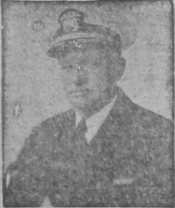
ALMIRANTE CHESTER W. NIMITZ Comandante de la Escuadra de los Estados Unidos en el Pacífico

Uno de los hombres que ha llevado a cabo los audaces y devastadores ataques de la flota de los Estados Unidos contra el Japón. Nimitz se caracteriza por su perfecta estrategia y su tremenda audacia y por un conocimiento completo de los mares del Pacífico.