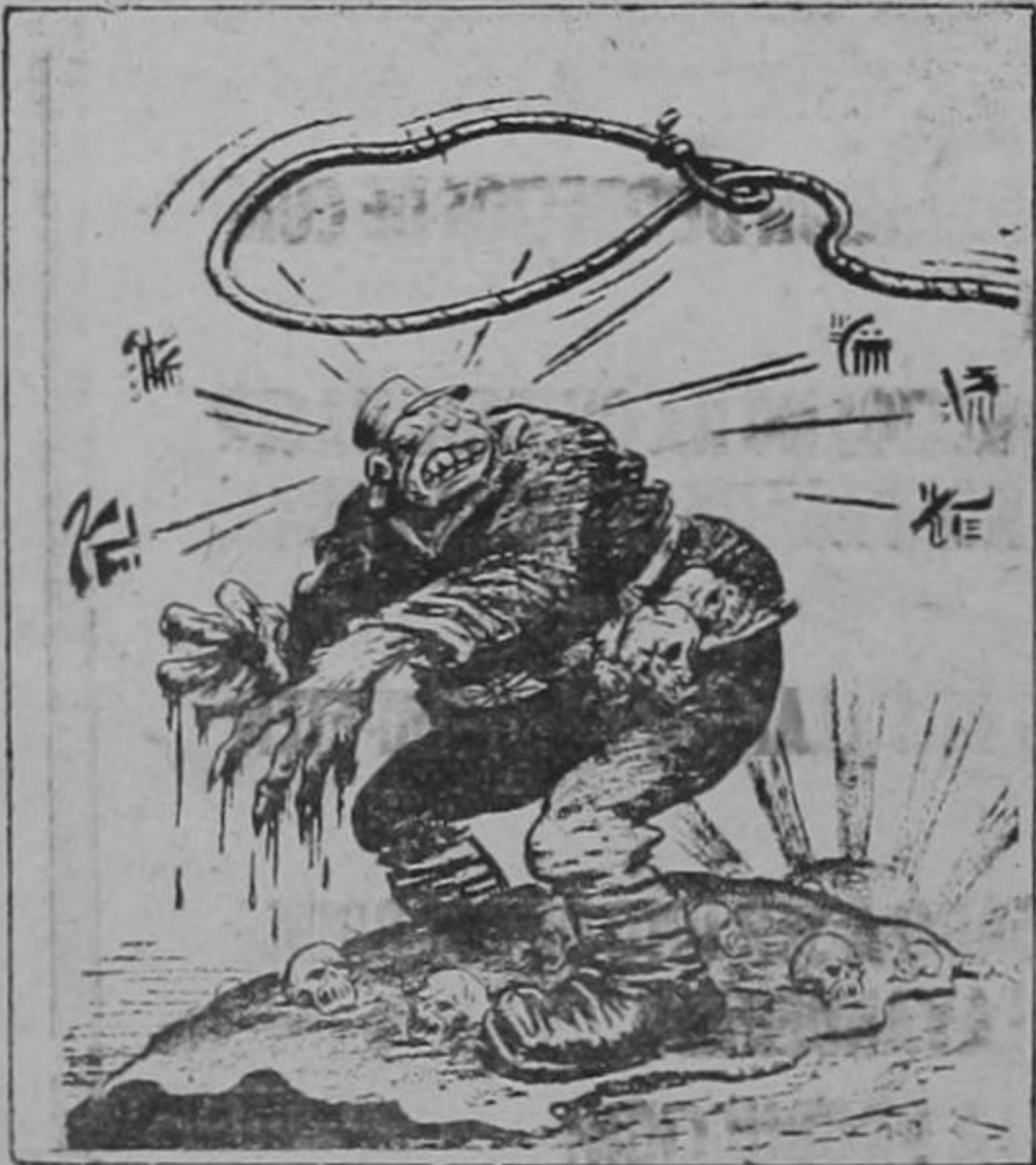
Talbot en el Cleveland News.