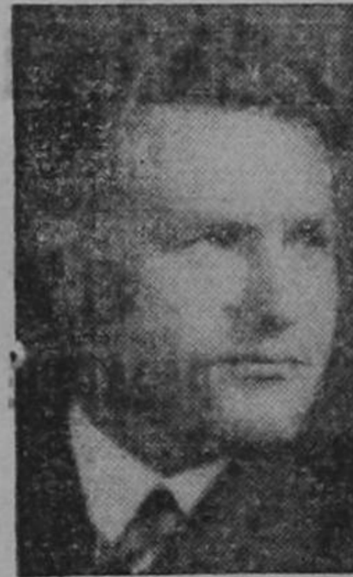
Nelson A. Rockefeller

WASHINGTON. — Declarando que "nosotros tenemos la oportunidad y la obligación de desarrollar dentro del Hemisferio Americano una comunidad de naciones prósperas, fuertes y productivas," el Secretario Auxiliar de Estado, Nelson A. Rockefeller, recomendó a las naciones americanas que se preparen para hacer frente a una intensificación de los problemas causados por la guerra, tales como el alza de los precios, la inflación, una mayor producción de artículos alimenticios y materias primas, y una mayor escasez de artículos y de buques para transportarlos. Al mismo tiempo, dijo, debe prestarse "cuidadosa y considerable atención," a los planes de la postguerra para aumentar las facilidades de educación, ampliar las obras de salubridad y saneamiento, los proyectos de economía básica, y desarrollar la industria, la agricultura, las minas, la energía hidroeléctrica y el comercio interamericano.