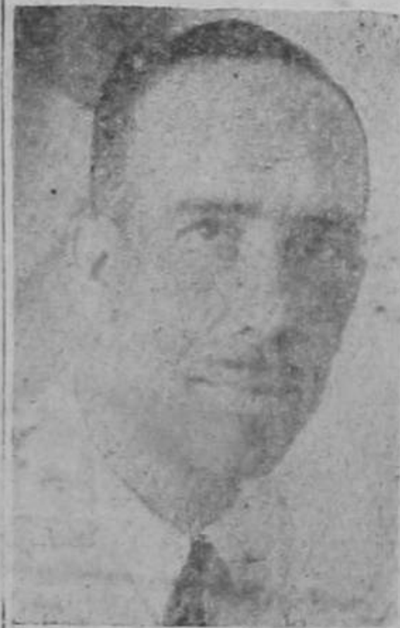
CASERES DE LA MOYA

que anunció con sospechosa anticipación la campaña emprendida contra el embajador Córdoba.