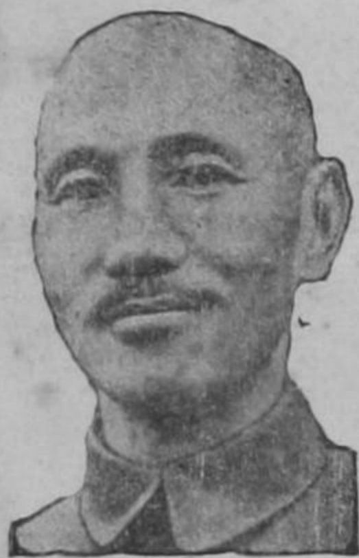
CHIANG KAI SHEK

BERNA 14. UP. — La respuesta japonesa a los términos de rendición de los aliados se recibió en