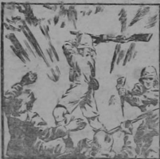
ABRIL 5 DE 1941:

A pesar de sostener la lucha en una inmensa extensión de mares y territorios lejanos, los ingleses se batían también en Abisinia. Los Sudafricanos derrotan a los italos y liberan Adis Abbeba.