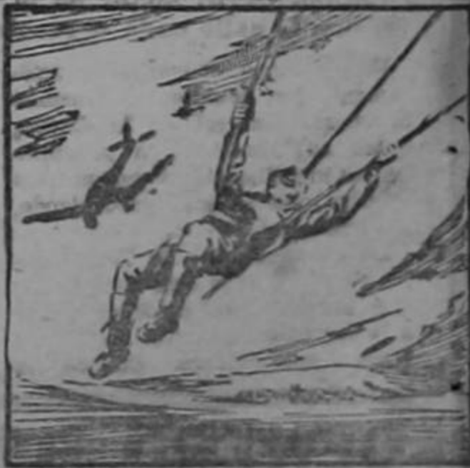
MAYO 10 DE 1941:

La lucha ha sido fiera en Grecia... y griegos e ingleses han defendido el terreno palmo a palmo... Pero las "panzer" y la superioridad aérea del enemigo los arrollan hasta obligarlos a embarcar.