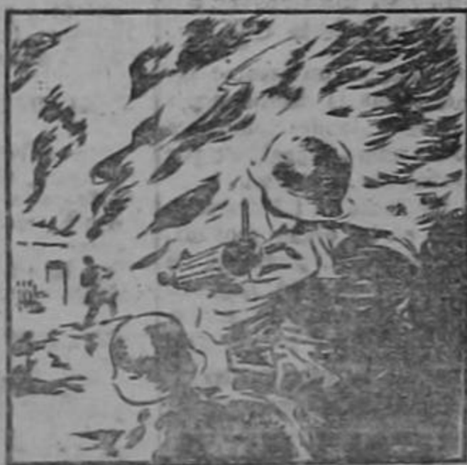
ABRIL 6 DE 1941:

A pesar de sostener la lucha en una inmensa extensión de mares y territorios lejanos, los ingleses se batían también en Abisinia. Los Sudafricanos derrotan a los italos y liberan Adis Abbeba.