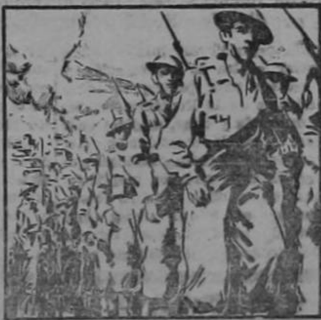
MAYO 2 DE 1941: