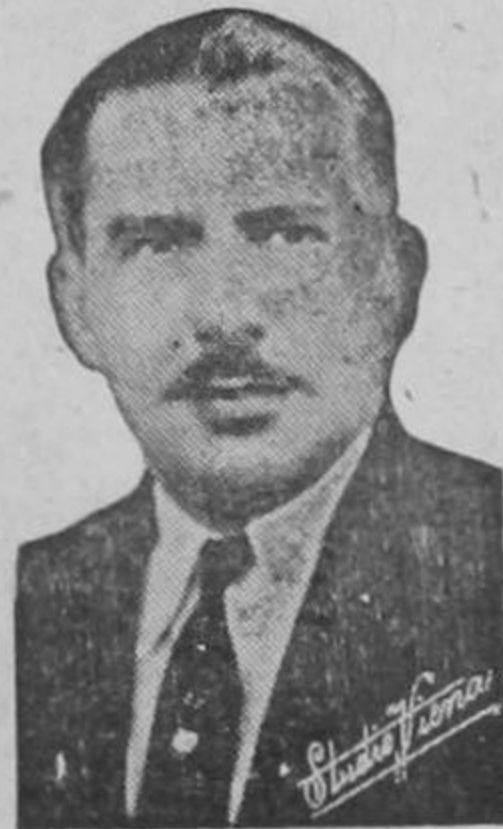
Lic. Don Teodoro Picado