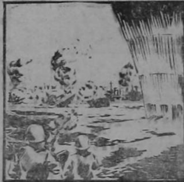
NOVIEMBRE 27 DE 1942