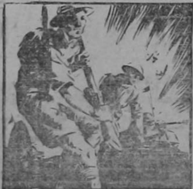
JULIO 2 DE 1942