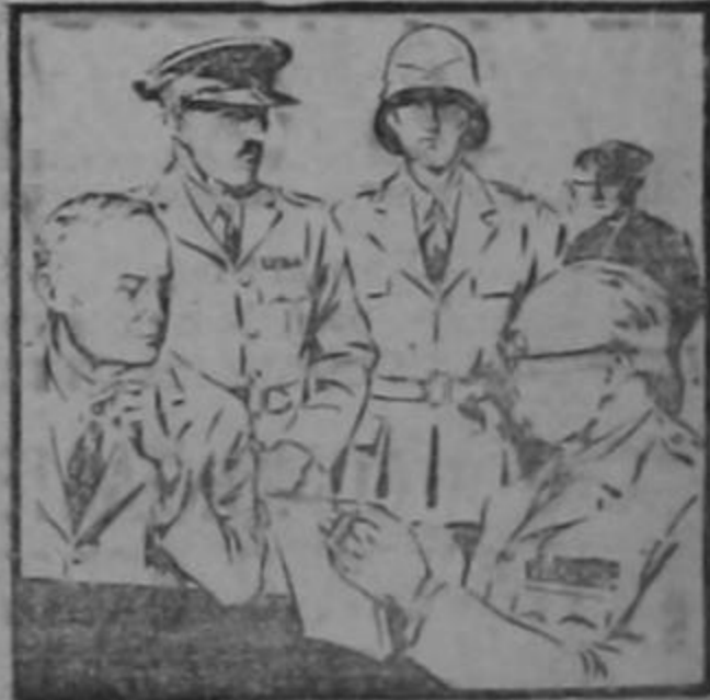
ENERO 19 DE 1943