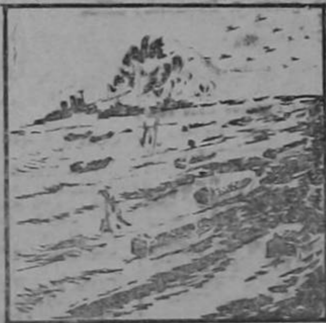
NOVIEMBRE 9 DE 1942