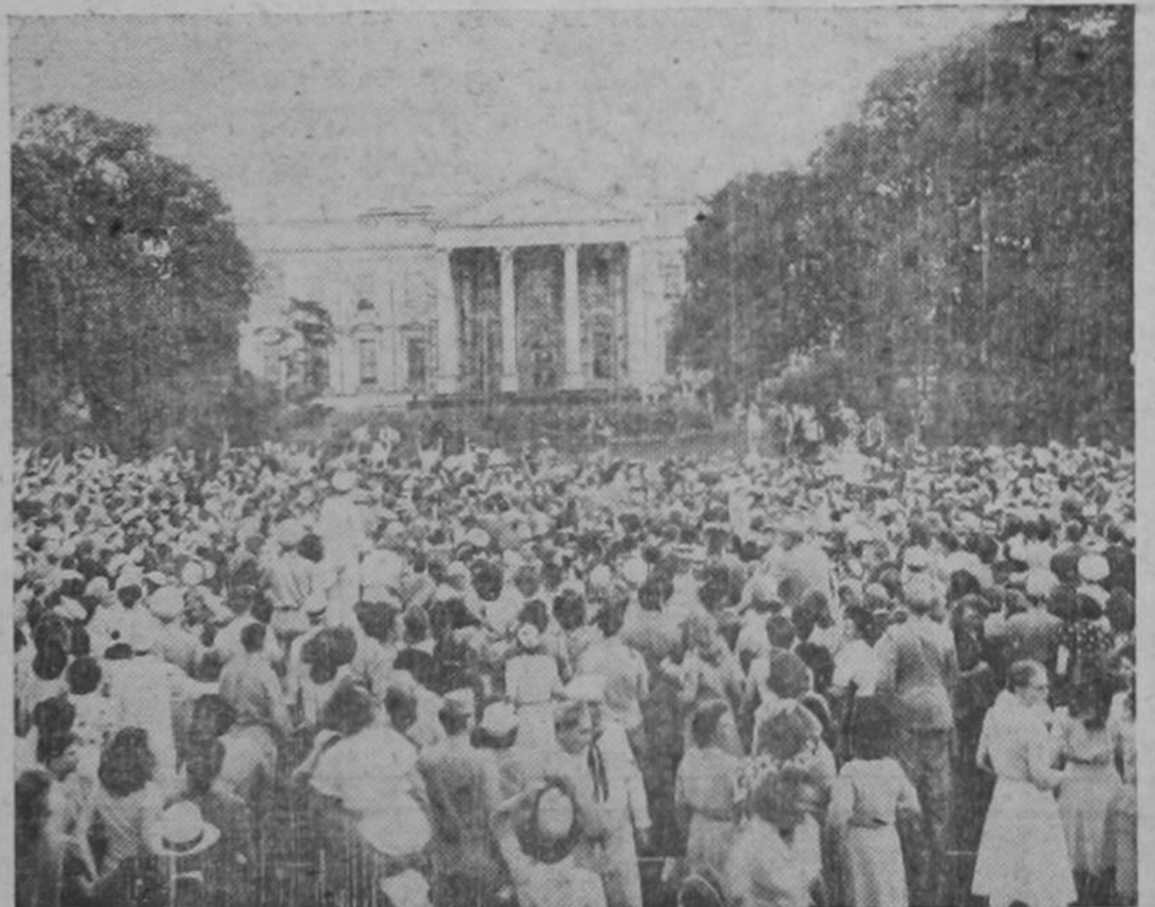
El gran gentío frente a la Casa Blanca en Washington, D. C., al anunciar el Presidente Truman la rendición incondicional del Japón.