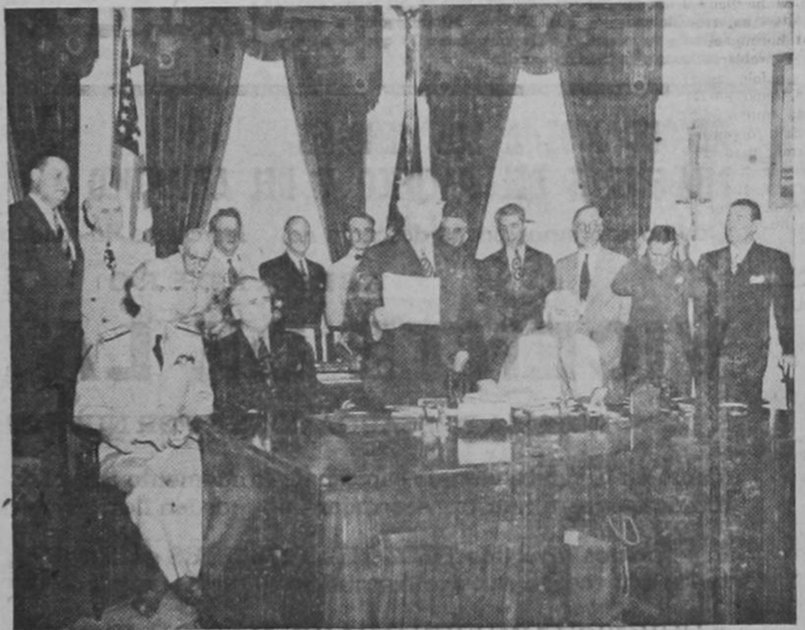
El Presidente Harry S. Truman, en la Casa Blanca, cuando anunció que el Japón aceptaba la rendición incondicional. De izquierda a derecha, sentados al lado del presidente están: El Almirante William D. Leahy, consultor militar de la presidencia; el señor James F. Byrnes, Secretario de Estado de los Estados Unidos, y el señor Córdell Hull, ex Secretario de Estado.