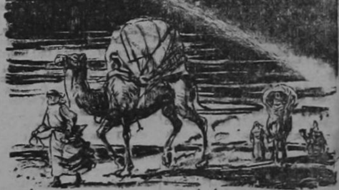
EL SITIO MÁS ÁRIDO DE LA TIERRA ES LA REGIÓN DE EGIPTO ENTRE LAS BAJAS CATARATAS DEL NILO. LA LLUVIA HA SIDO TAN RARA ALLÍ QUE LOS INDIGENAS NO CREEN QUE PUEDE CAER AGUA DEL CIELO.

LA CASA VOLADORA ESTA CASA FUÉ LEVANTADA POR UN HURACÁN Y DEPOSITADA EN DEENEMÜNDE (DONDE SE INVENTARON LAS BOMBAS VOLADORAS) DOS AÑOS DESPUÉS OTRA TEMPES-TAD SE LA LLEVÓ LEJOS PERO UN AÑO MÁS TARDE VOLVIÓ EN ALAS DEL VIENTO — Y SE HA QUEDADO ALLÍ