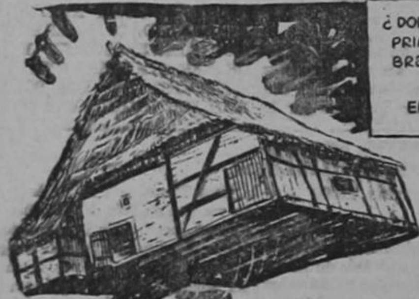
¿DONDE COMENZO PRIMERO EL HOMBRE A REZAR A DIOS? EN ESPAÑA

Washington, 8. UP. — Una delegación norteamericana presidida por el Secretario del Interior Harold Jackes iniciará conversaciones con los representantes británicos en Londres el próximo diecisiete de septiembre sobre la renovación del convenio petrolero anglo americano.