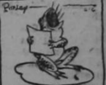
ESTÁS EN MI CORAZÓN LAS RANAS FUERON LAS PRIMERAS QUE CANTARON CANCIONES AMOROSAS, PORQUE FUERON LAS PRIMERAS QUE TUVIERON PULMONES