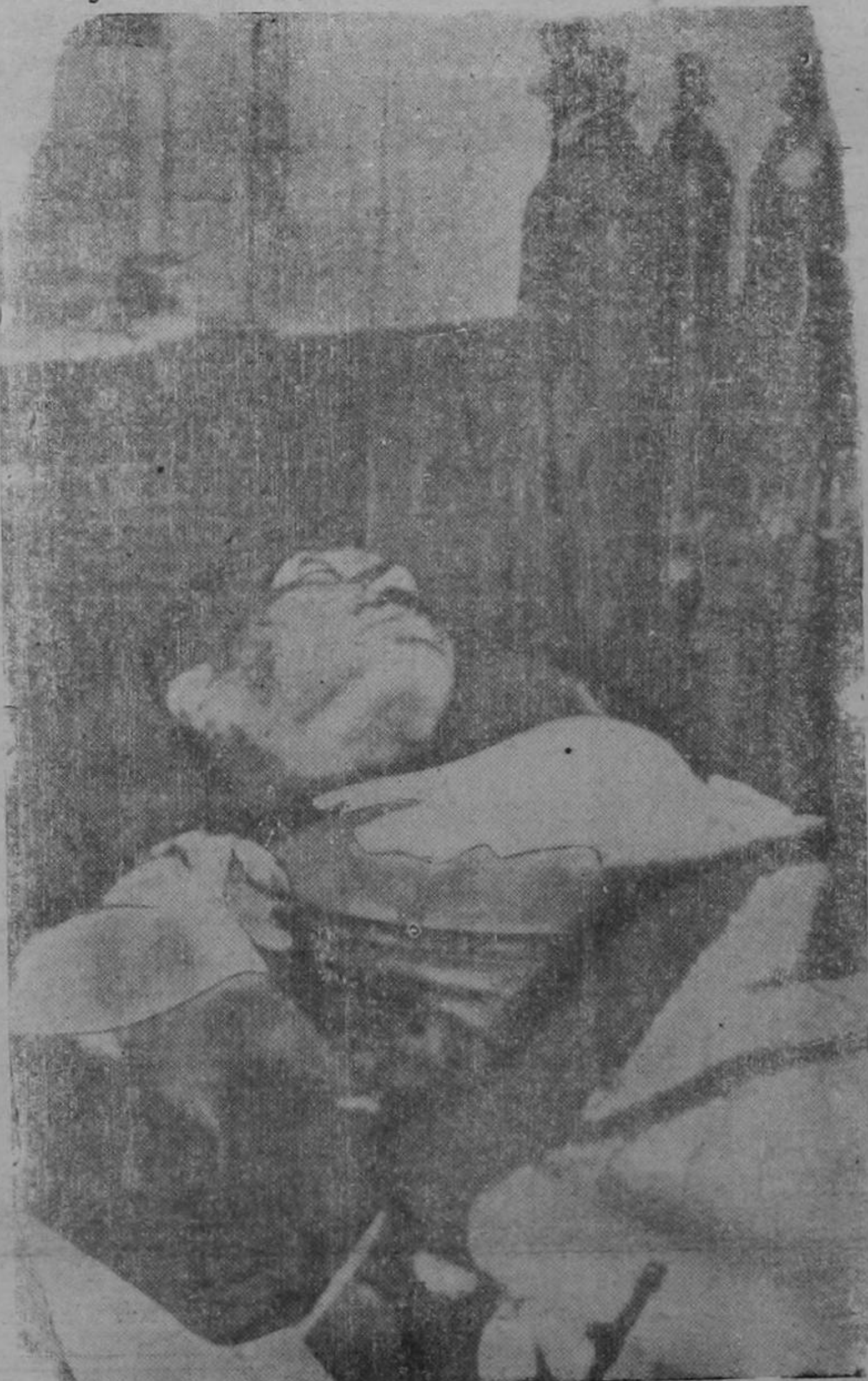
Patética foto del general Tojo, herido a bala en un frustrado intento de suicidio. Esta es la mejor foto del orgullo hecho pedazos del "gran señor de la guerra".

Mañana, Jueves, PALACE! Debut deslumbrante de la Compañía de Revistas y Variedades: