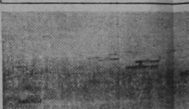
Vista panorámica de una parte de la costa de los Estados Unidos que bombardeó el coral hasta lograr su capitulación.

WASHINGTON.—Con motivo de la celebración del Día de la Marina, el Presidente Truman rindió un tributo de honor a los cuatro millones de hombres que integran las fuerzas armadas de la escuadra, la infantería de marina y el servicio de guardacostas de los Estados Unidos, a quienes "debemos nuestra victoria en la guerra naval más gigantesca de la historia humana."