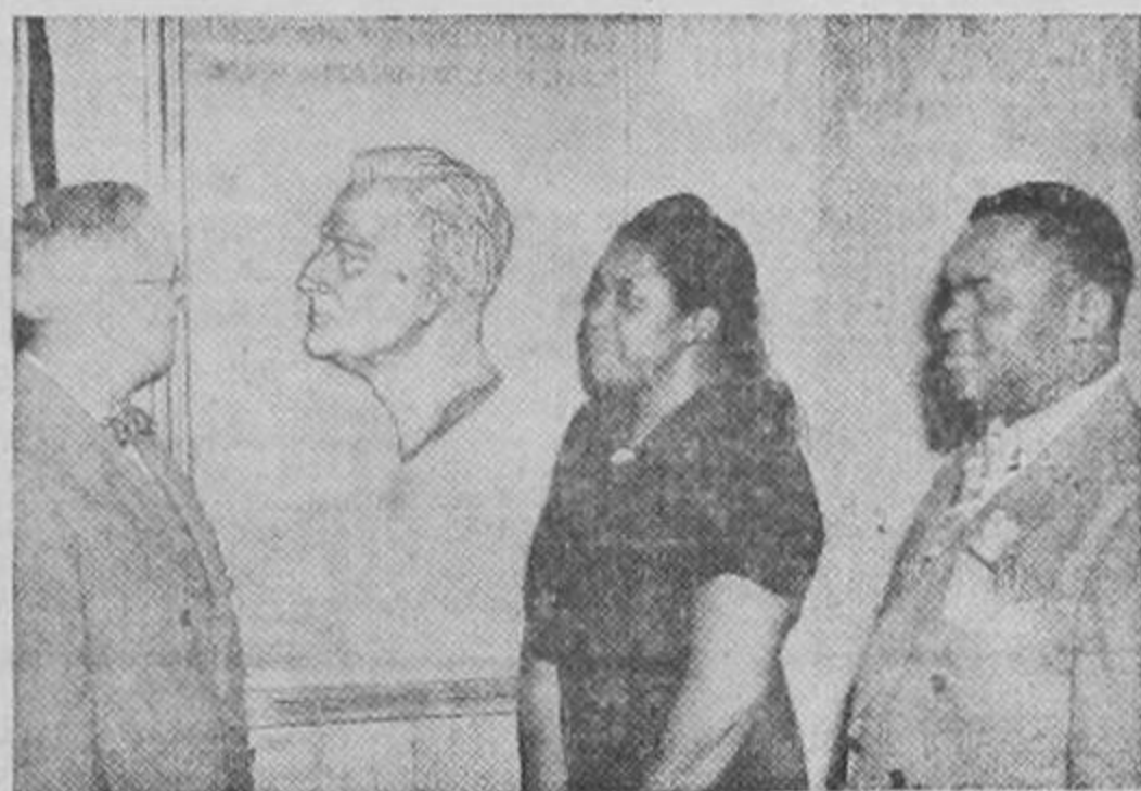
El Presidente Truman admira la placa con el busto del finado Presidente Roosevelt, obra de la escultora de la raza de color Selma Burke, al ser develada en el edificio del Registrador de la Propiedad en Washington.

WASHINGTON. — El Presidente Truman declaró recientemente que el mundo "marchará directamente a la destrucción" a menos que perfeccione un organismo mundial para conservar la paz.