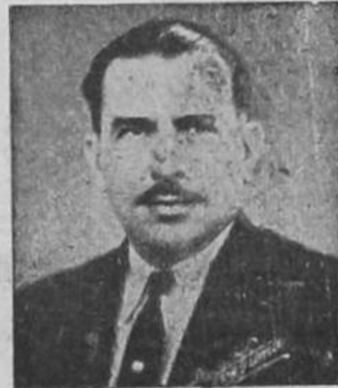
LIC. DON TEODORO PICADO