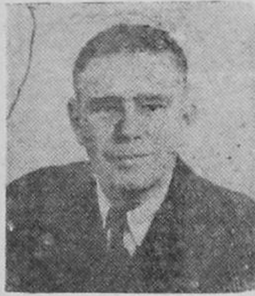
DON OTILIO ULATE

En la sesión de esta tarde el congreso entrará a conocer del proyecto de emisión de 16 millones de colones destinados a pagar la deuda flotante. El proyecto se aprobará, según las fuerzas de la Cámara. También puede anunciarse que si bien está garantizada su aprobación, también son seguras algunas enmiendas, entre otros que (PASA a la Pág. SIETE)