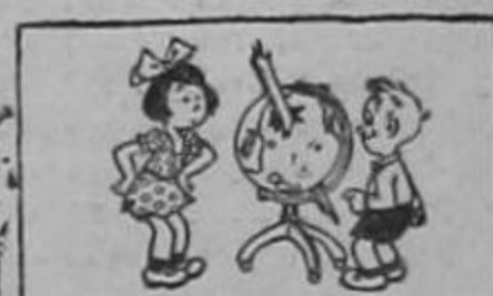
UN RAYO QUE CAYO EN UNA ESCUELA de E.U.A. LANZO UNA ASTILLA DE MADERA A TRAVES DE UN GLOBO GEOGRAFICO, ELIMINANDO POR COMPLETO AL JAPON

HACE COMO 200,000 AÑOS QUE ESTA ENORME MOLE FUE ARRASTRADA POR LA CORTEZA DE HIELO TERRESTRE DESDE LAS ISLAS ALAND, EN EL MAR BALTICO, HASTA DAMM EN LA RENANIA. SE CALCULA QUE LA TRAVESIA DURO COMO 50,000 AÑOS.