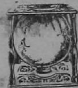
EN NUEVA YORK EN 1898 SE USARON PECERAS COMO URNAS ELECTORALES