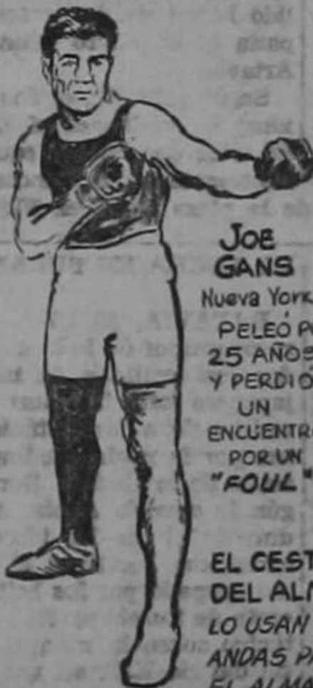
JOE GANS Nueva York PELEÓ POR 25 AÑOS Y PERDIÓ UN ENCUENTRO POR UN "FOUL"

EL CESTO DEL ALMA REAL LO USAN LOS WAGANDAS PARA GUARDAR EL ALMA DE SU DIFUNTO REY ESTOS CESTOS ESTÁN A CARGO DE LAS VIUDAS DEL MONARCA