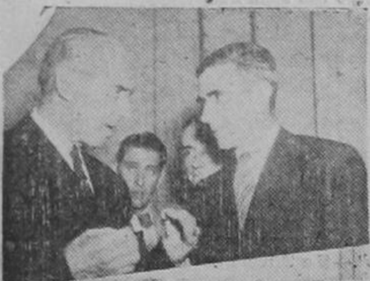
El Excmo. Sr. Presidente Ríos conversa con el periodista don Manuel Formoso, en la conferencia de prensa de anoche.

Subí al poder sobre una coalición de partidos: el mío, que es el radical, el socialista, el comunista, el agrario y otros; con ellos no tengo más compromiso que el de seguir una línea de acción izquierdista