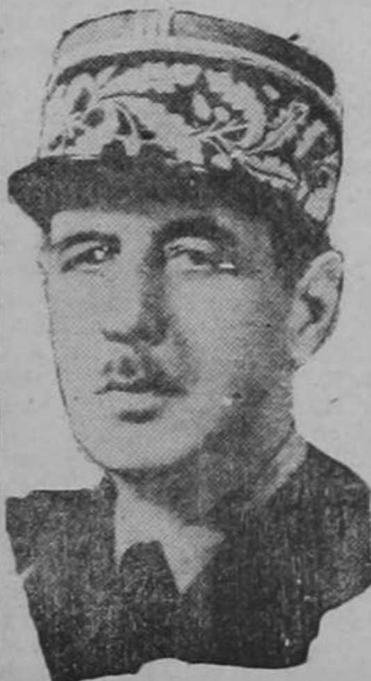
GENERAL DE GAULLE

PARIS, 13.—UP.—El general Charles De Gaulle fué electo jefe de las y republicanos populares voto del gobierno francés por 555 votos por De Gaulle.