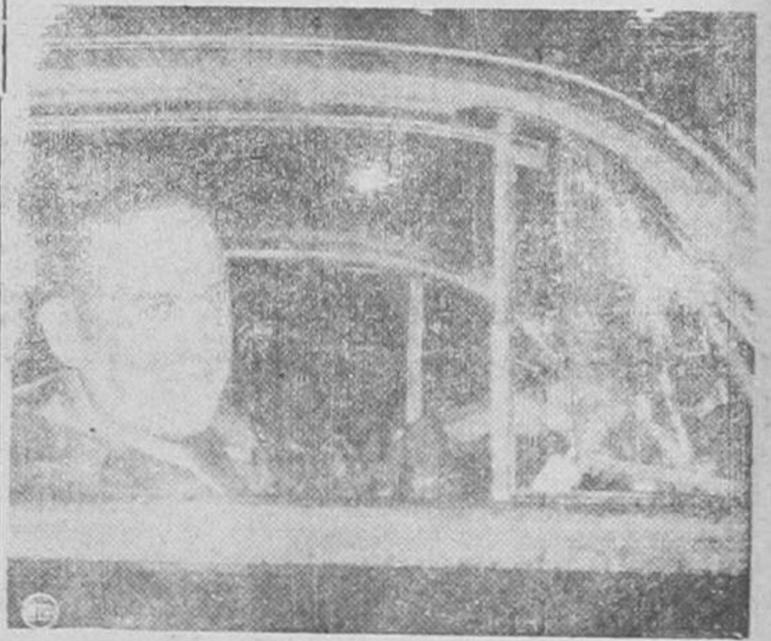
Herbert Sorrell, líder de los trabajadores de la industria cineamográfica que recientemente han declarado el estado de huelga en Hollywood, Calif., muestra a la policía el hueco que una bala hizo en su automóvil. El Sr. Sorrell dice a la policía que otras seis balas le fueron disparadas

LONDRES, 18. UP.— En tanto se anunciará hoy en la capital inglesa la próxima llegada del ministro de estado del gobierno de la República Española en exilio, Fernando de los Ríos, con el fin de tratar de entrevistarse con el Primer Ministro Inglés, Clement Attlee y el ministro de relaciones exteriores, Ernest Bevin, sobre el problema de España, el Daily Herald, órgano oficioso del Partido (Pasa a la Página 8)