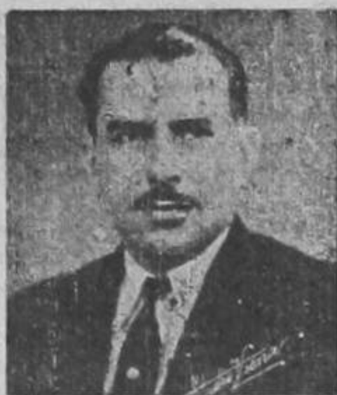
LIC. DON TEODORO PICADO

Durante los días de los festejos cívicos se trató de llevar al público la falsa alarma de que había sido descubierto un complot revolucionario y de que el gobierno se había visto obligado a hacer numerosas detenciones de extranjeros que se decía comprometidos en ese complot. En las pizarras de un periódico de la mañana se recogieron esos rumores y se consignaron noticias alarmistas. En tal virtud el señor Presidente de la República, licenciado don Teodoro Picado se apresuró a desmentir categóricamente tales rumores por medio de una declaración que se con-