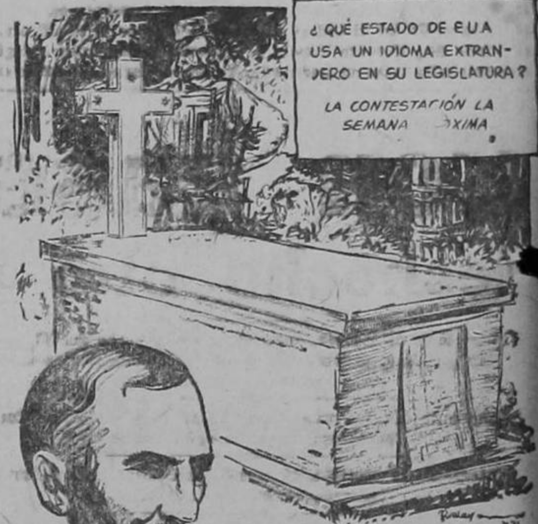
JONAS HANWAY EL PRIMERO EN USAR PARAGUAS POR ESA RAZON SE HA ERIGIDO UNA ESTATUA BUVA EN LA ABADIA de Westminster

quillo de los acusados en Nuremberg que Hitler calificó en su testamento de "hombres honorables". También se dió a conocer una orden de Hitler altamente secreta de 1942 en que disponía que los civiles que cometieran actos de sabotaje en los territorios ocupados fueran trasladados por la gestapo a Alemania para hacerlos "desaparecer sin dejar rastro". Hitler justificaba su orden de suprimir inclemente a los "comandos" con la afirmación de que las ordenes aliadas que habían sido capturadas revelaban que esos comandos tenían instrucciones de dar muerte a prisioneros indefensos en una carga. La orden de ejecutar a las tropas de los comandos "hasta el último hombre" exceptuaba a los pilotos que se vieran forzados a bajar en territorios ocupados por los alemanes y a los soldados transportados por aire, dedicados a operaciones de desembarque en gran escala. Storey recordando al tribunal que Goering fué el primer jefe de la gestapo, dijo que la sangrienta historia de crímenes se asemejaba al libro de notas del diablo.