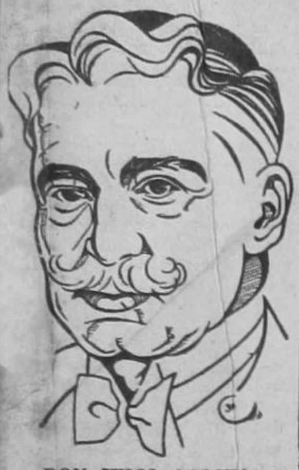
DON JULIO ACOSTA

"Implicaría sin duda regresar a la política de intervención en los asuntos domésticos de cada república y al fuego de intrigas de los bandos políticos derrotados y de recelos entre los gobiernos, que tanta intranquilidad causaron en el ambiente americano"