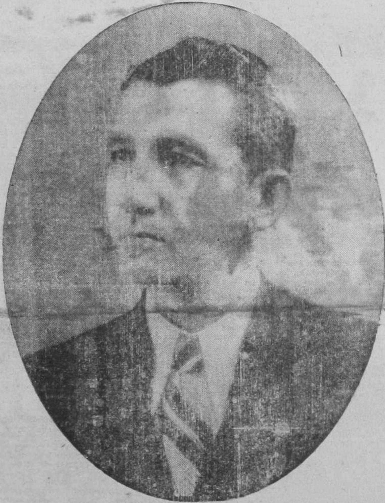
LICENCIADO DON LEON CORTES CASTRO

LA NOTICIA DE LA SUBITA MUERTE DEL ILUSTRE EX-PRESIDENTE DON LEON CORTES CASTRO CONMUEVE PROFUNDA Y DOLOROSAMENTE A TODOS LOS SECTORES DE LA REPUBLICA