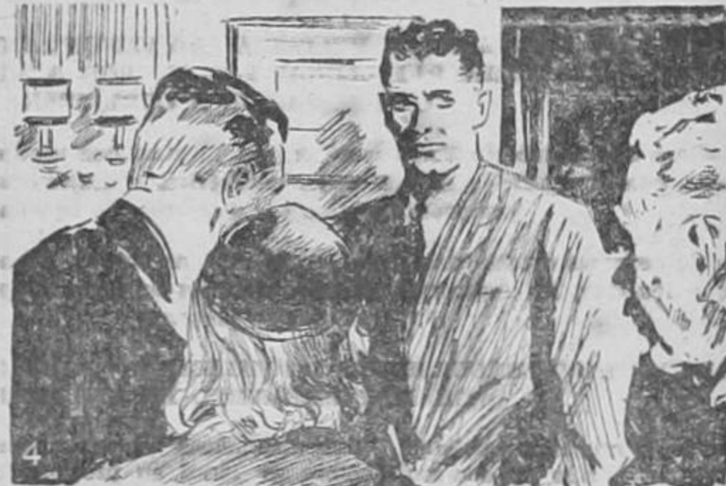
Tome, dijo ella. Va usted a necesitar esto...