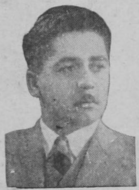
DON ALVARO CUBILLO