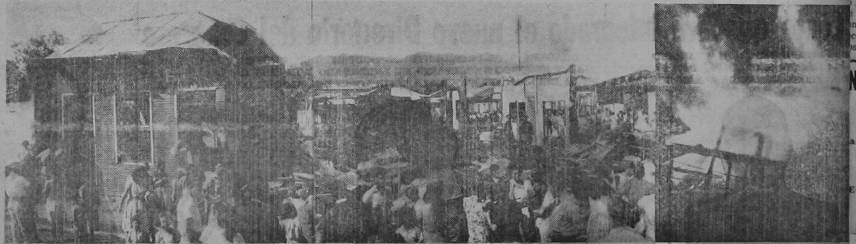
* LAS TRES ESPLENDIDAS FOTOGRAFÍAS CORRESPONDEN A TRES DISTINTOS ASPECTOS DEL GRAN SINIESTRO QUE SE REGISTRO ANOCHE EN EL BARRIO LUJAN, DE ESTA CIUDAD, Y EN EL QUE SE PERDIERON CATORCE CASAS, Y CUATRO FUERON DAÑADAS POR LOS BOMBEROS E INQUILINOS PARA AISLAR EL FUEGO