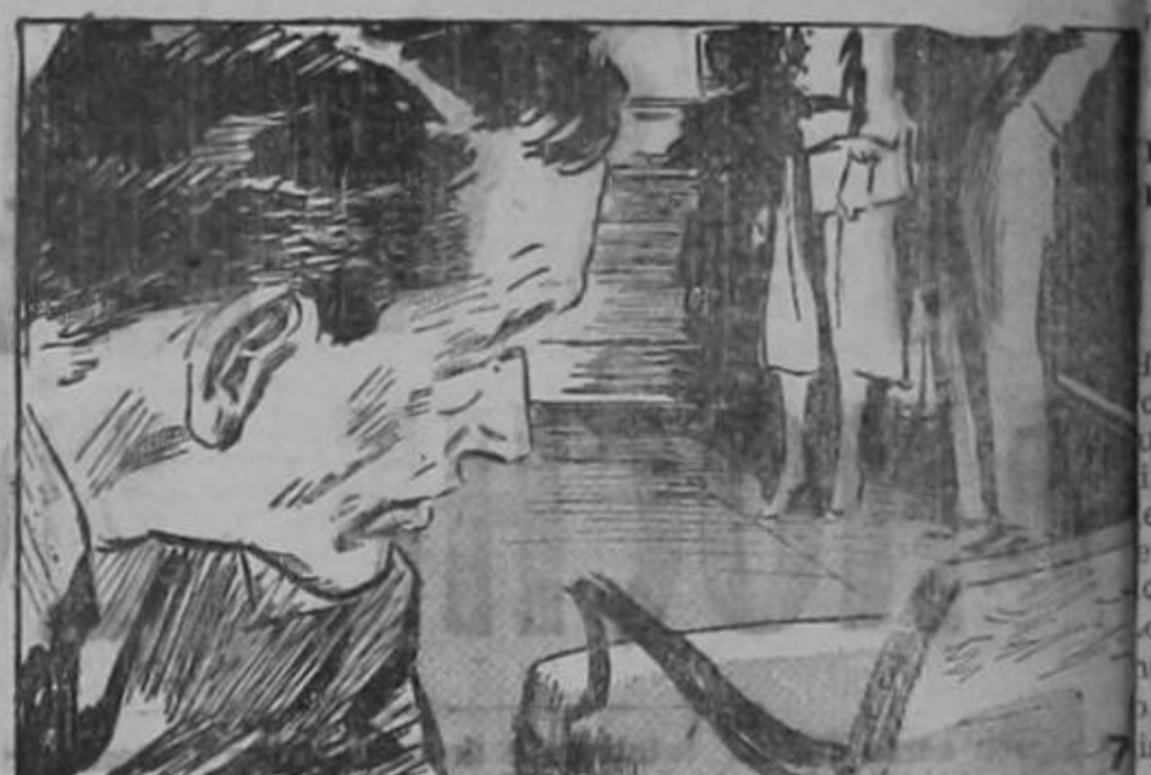
—Mason tomó varias cartas...