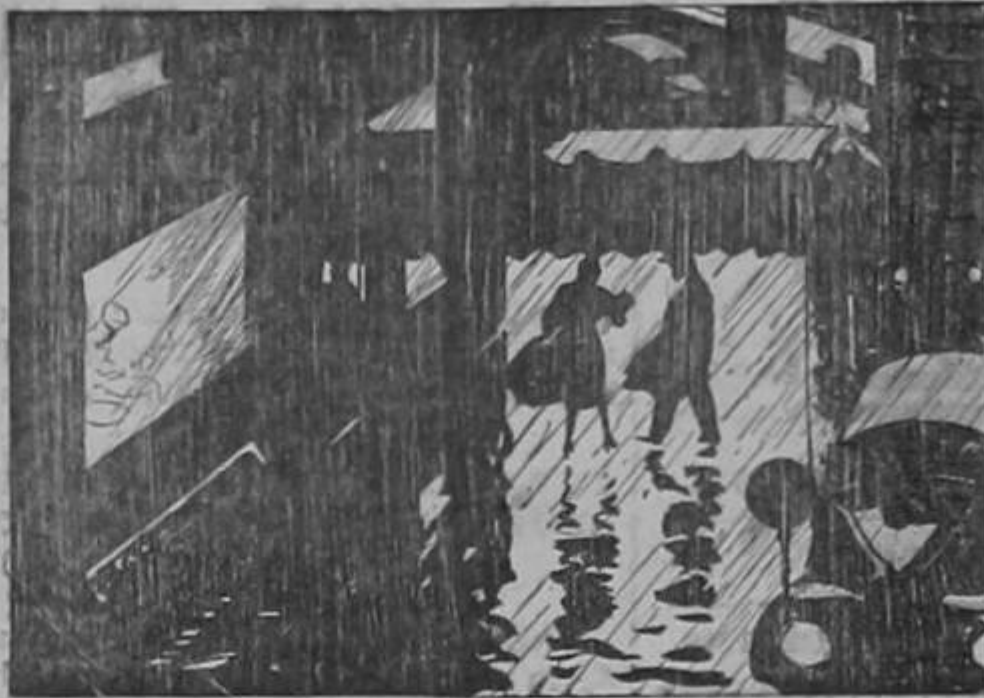
El Abogado y Della buscaron refugio de la lluvia...