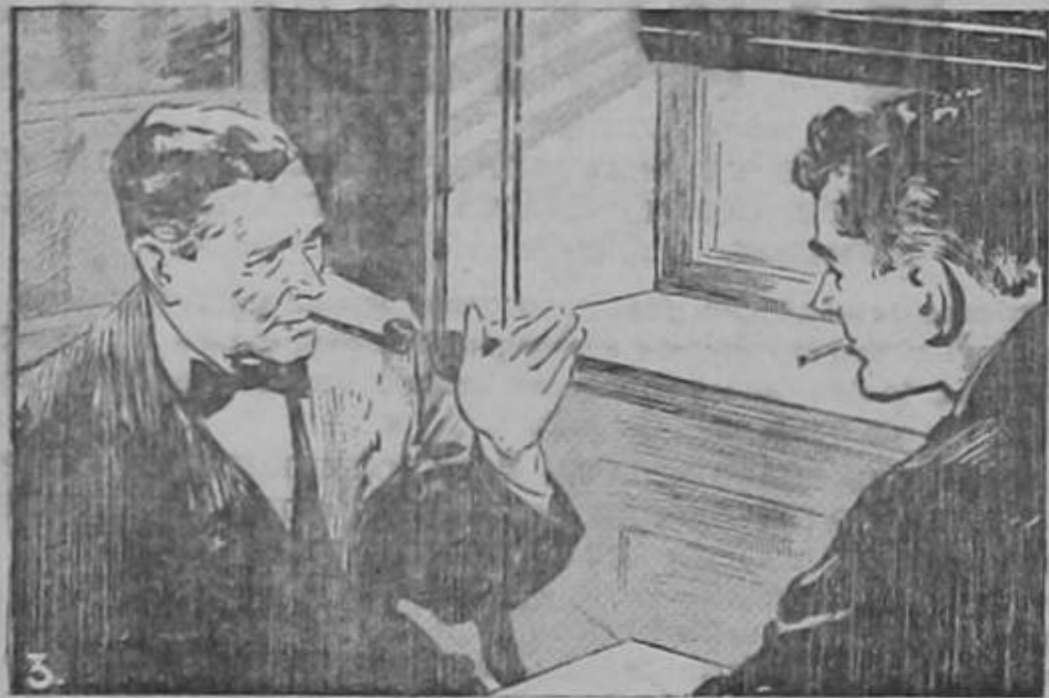
Supe que había nacido un nieto, le dijo Bartsler a Mason.