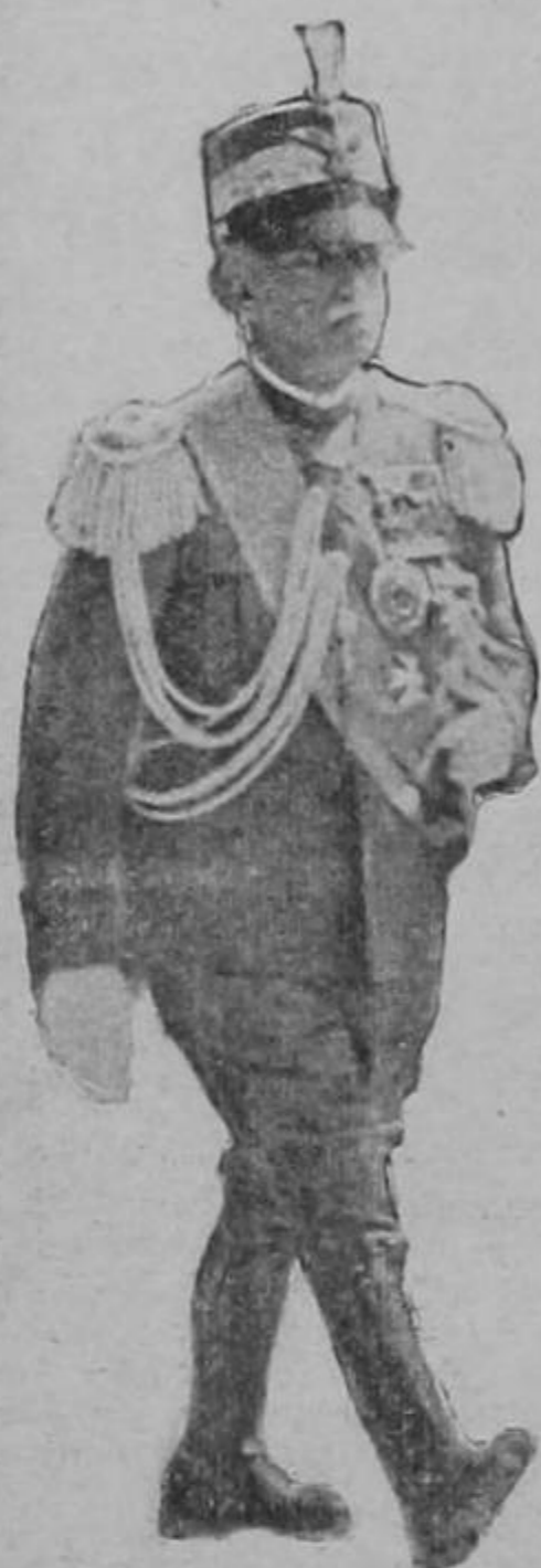
REY VICTOR MANUEL

ROMA 9 UP.—El Príncipe Humberto partió hoy por la vía aérea hacia Nápoles, para obtener la carta de abdicación del Rey Víctor Manuel, que éste avisó por teléfono que estaba ya lista. El Príncipe Humberto llevó consigo el borrador de una proclama que se propone hacer al pueblo italiano a fin de consultar la opinión del soberano sobre su tenor. La visita del Príncipe heredero Humberto a su padre, coincide con la ceremonia íntima de despedida del soberano que habrá de tener lugar en la Villa Real de María Pía, conocida antiguamente con el nombre de Villa Roseberry y donde se desarrolló el histórico idilio entre Lord Nelson y Lady Hamilton. El gobierno inglés regaló la villa a Mussolini antes de que el duce se embarcara en su infame aventura imperial de la conquista de Etiopía. De fuente digna del mayor crédito se ha sabido que los gobiernos de Inglaterra y Estados Unidos, al aprobar el plan de abdicación al mismo tiempo han insistido en que cuando el Príncipe Humberto suba al trono, conserve los mismos poderes que ejerció como teniente general del Reino. De este modo no sufrirán alteración alguna los acuerdos concertados entre el comité de liberación y el Príncipe Humberto en la reunión de Salerno y en las que le siguieron.