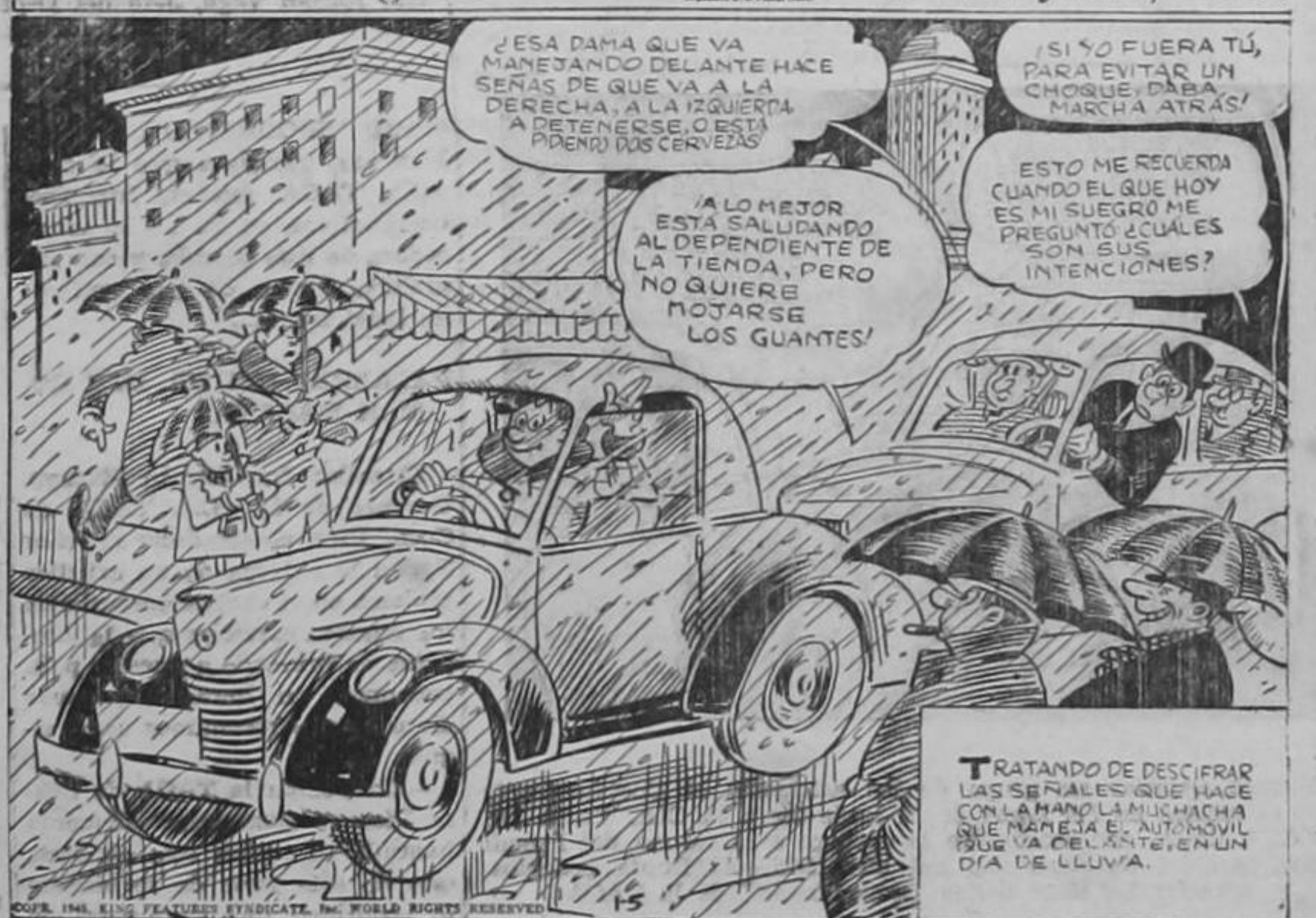
TRATANDO DE DESCIFRAR LAS SEÑALES QUE HACE CON LA MANO LA MUCHACHA QUE MAREJA EL AUTOMÓVIL QUE VA DELANTE EN UN DÍA DE LLUVIA.