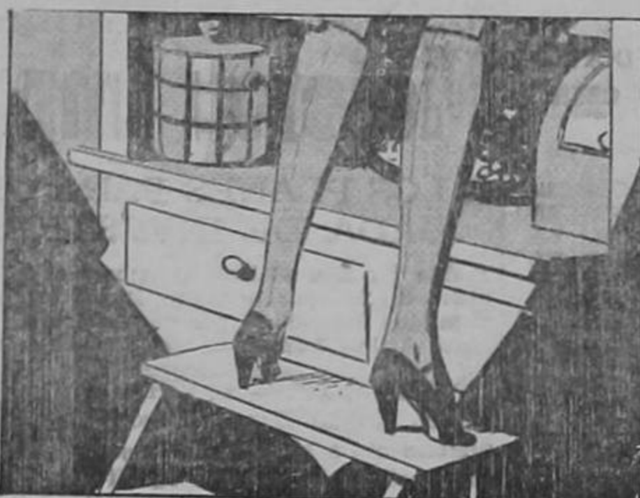
Della registraba la despensa en busca de la lata de galletas