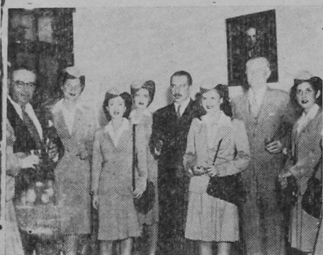
El señor Embajador de los Estados Unidos, Mr. Hallet Johnson; el señor Presidente de la República, Lic. don Teodoro Picado, y el señor Secretario de Agricultura, don José Joaquín Peralta, acompañados de siete bellas "stewardesses" de la Taca, en la recepción brindada por dicha compañía en el Club Unión.