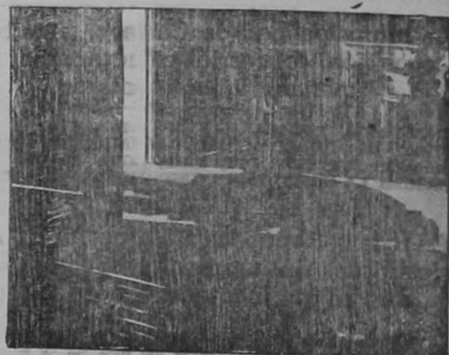
La puerta se abrió... Una sombra avanzó sobre la alfombra.

Ella Brockton invitó a entrar a los tres, pero en la entrevista que siguió se mostro lacónica y fría. Los ojos negros de la mujer brillaban cuando supo que Mildred Danville había sido asesinada. — Ella se lo buscó, dijo.