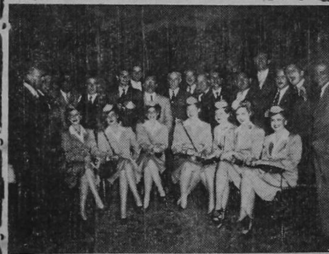
Podemos apreciar un grupo de los asistentes al Cocktail-Party que el martes en las horas de la tarde dió la CIA. TACA DE COSTA RICA, con motivo de la entrega a la misma del Premio Internacional de Seguridad del año 1945.—Al frente podemos apreciar las siete bellas "stewardesses" de la TACA

Después de haber escuchado aquellas breves y hermosas palabras, se dió una espléndida recepción que mereció justificadamente el elogio de todos los concurrentes. Este es un claro ejem-