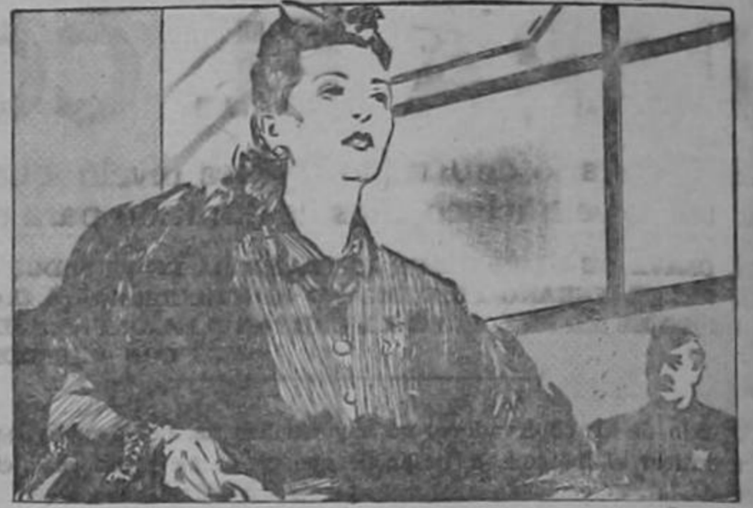
La señora Barstler dijo: —Mildred había secuestrado a mi hijo!

CUANDO el fiscal comenzó a presentar como prueba las fotografías tomadas en el lugar del crimen, Mason entró en acción. Se abstuvo cuidadosamente, sin embargo, de revelar la importancia que él daba al tanque de agua.