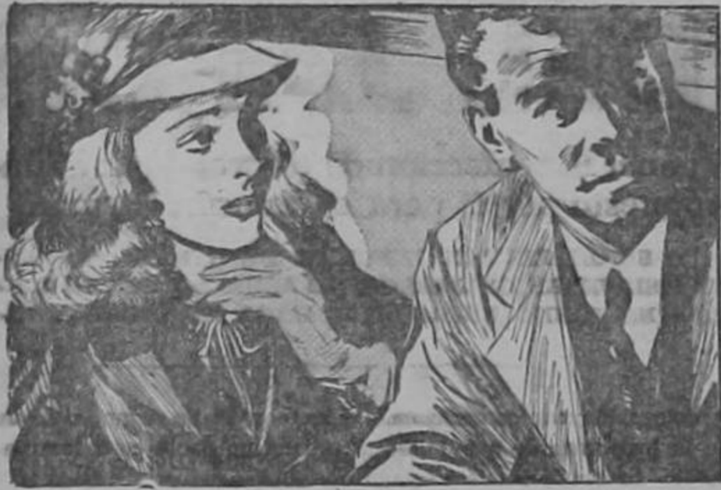
Diana Regis miró a Mason con ansiosa solicitud.