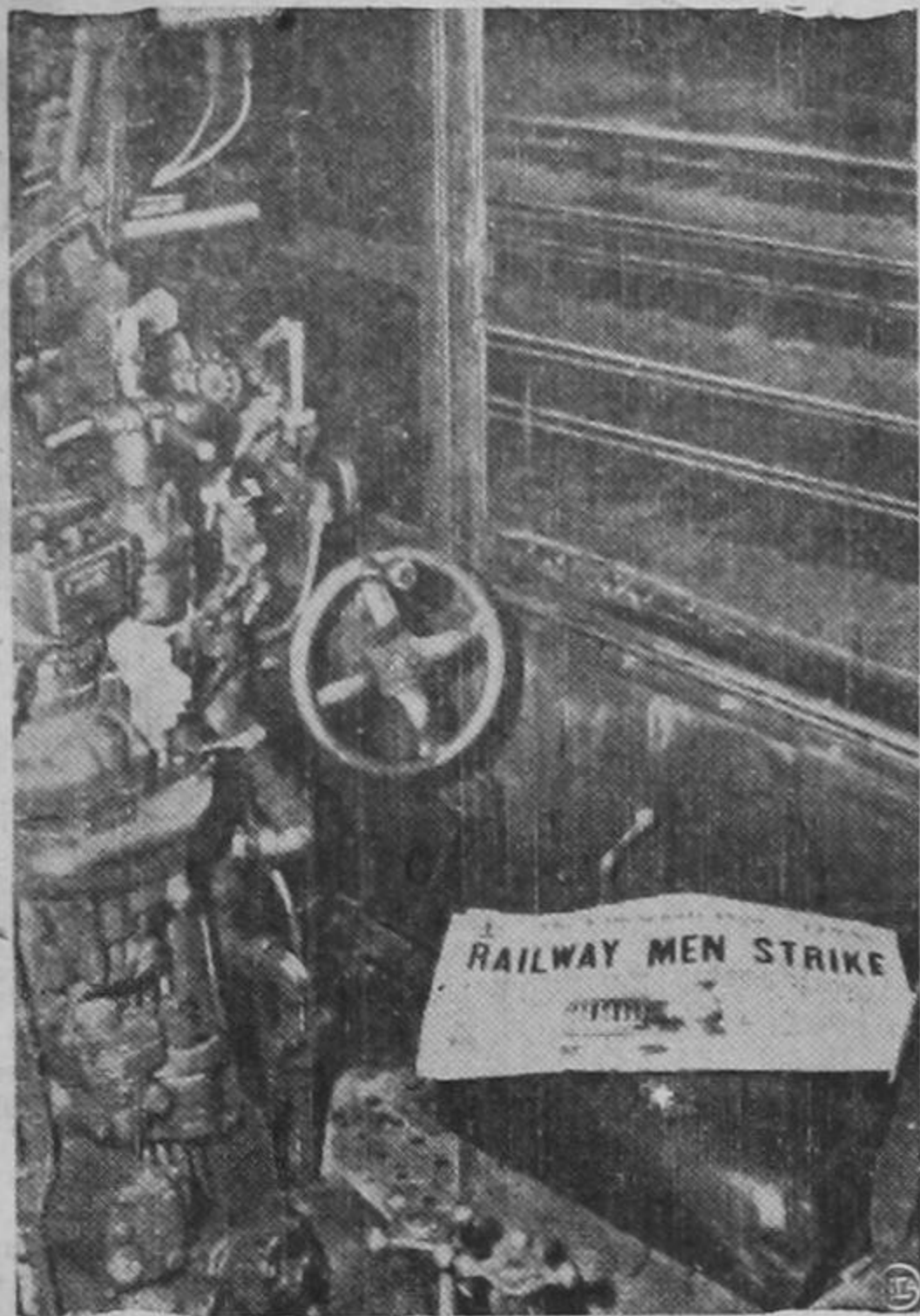
LOS HUELGUISTAS han dejado únicamente un letrero como el que aparece en esta fotografía. Han abandonado las locomotoras que por espacio de muchos años han corrido por las líneas férreas de los Estados Unidos