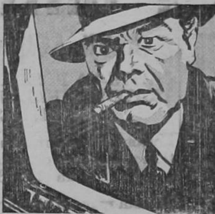
—Usted ha cometido un robo, —dijo.