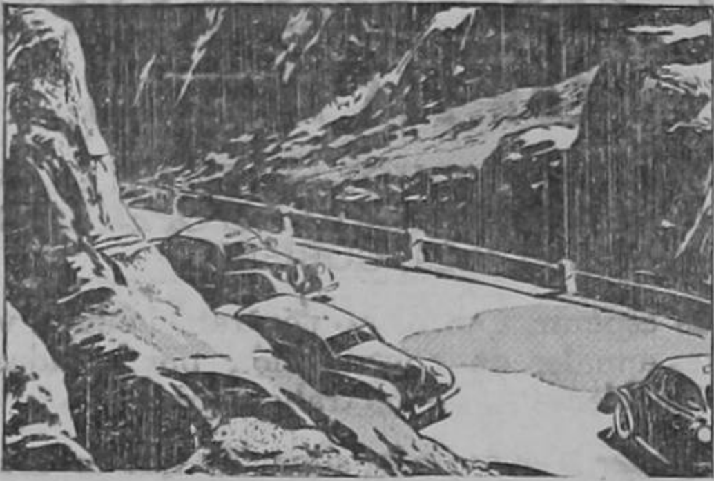
Sonó una sirena y dos automóviles policiacos se acercaron...