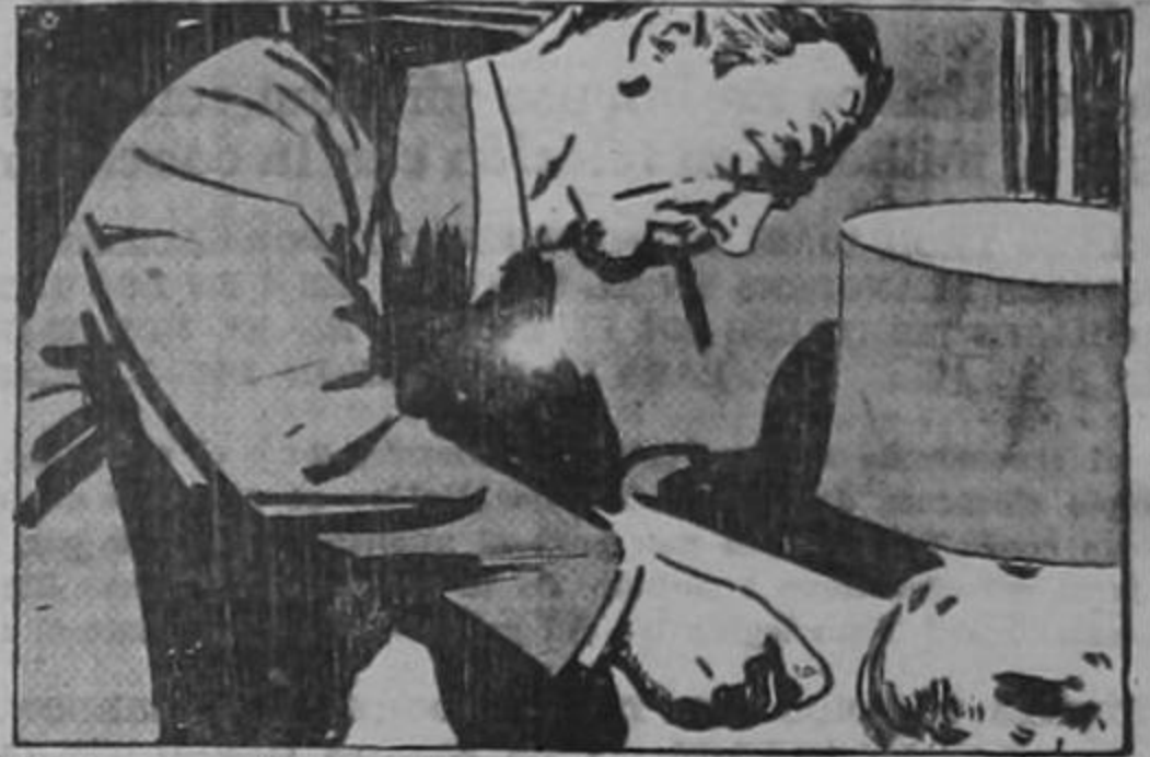
—¿Le esperaba el señor Bartsler?—preguntó Fretch.—¿A qué se debe esta visita?—preguntó Bartsler. Oprimió el botón de un timbre.—Usted tiene razón,—dijo

Cuando Perry Mason oprimió el timbre en la residencia de Jason Bartsler, Carl Fretch abrió la puerta. El joven asumió una actitud indiferente. —Le espera a usted el señor Bartsler?, preguntó. —Debía estar esperando me, dijo Mason. Con un gesto de aburrimiento, Carl Fretch se perdió en otra parte de la casa. Regresó, diciendo: —El señor Bartsler le recibirá. Della dijo con sarcasmo, —¿Qué amable es usted! Bartsler estaba sentado ante su mesa en la biblioteca. —Hola, dijo. —¿A qué se debe esta visita?