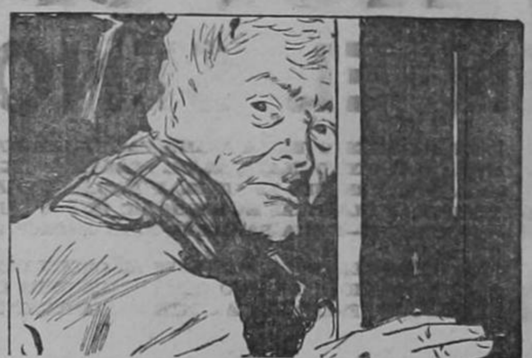
Había un enorme diccionario sobre la mesa; él lo miró.