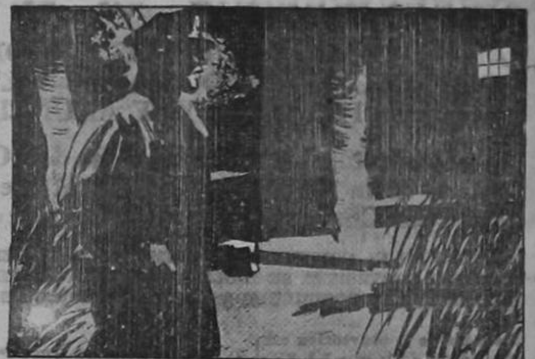
Salieron a toda prisa; Mason dijo: —¡Sube, guiaré yo!