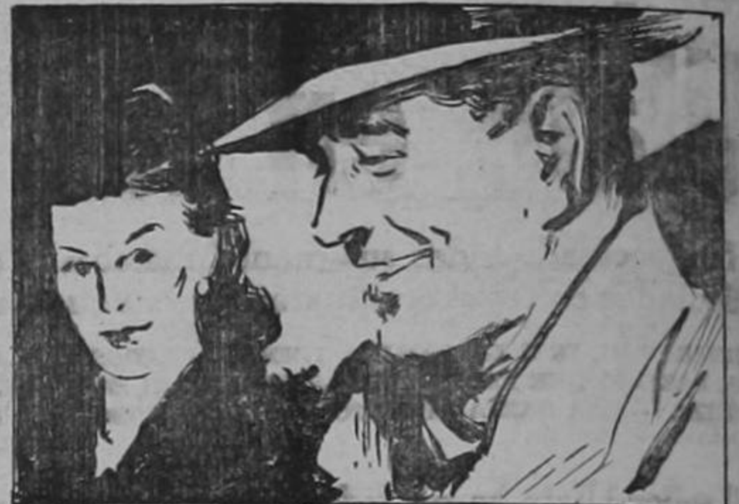
—Vamos a comer,—dijo Mason.—;Creo que nos la hemos ganado!

Bartsler preguntó. — ¿Y cómo está usted aquí, Mason? El abogado sonrió. — me imaginé lo que iba a pasar.