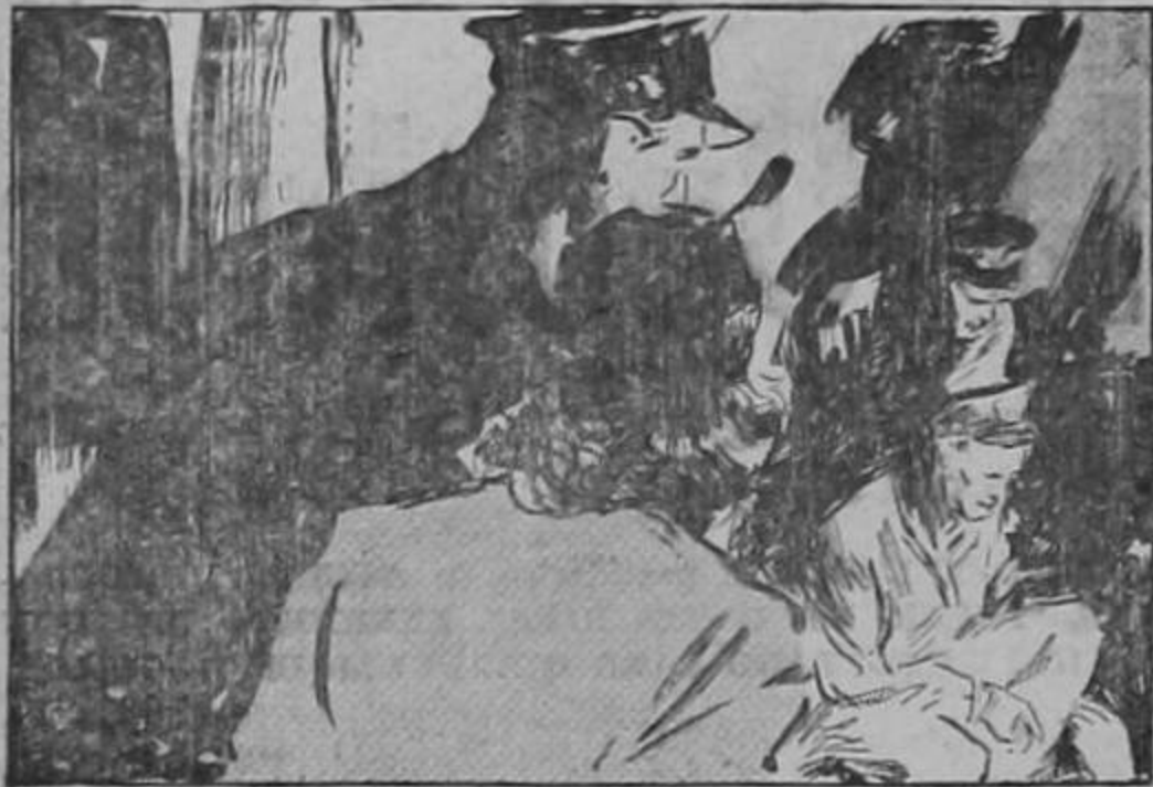
Della fué a tomar la declaración de Glenmore agonizante