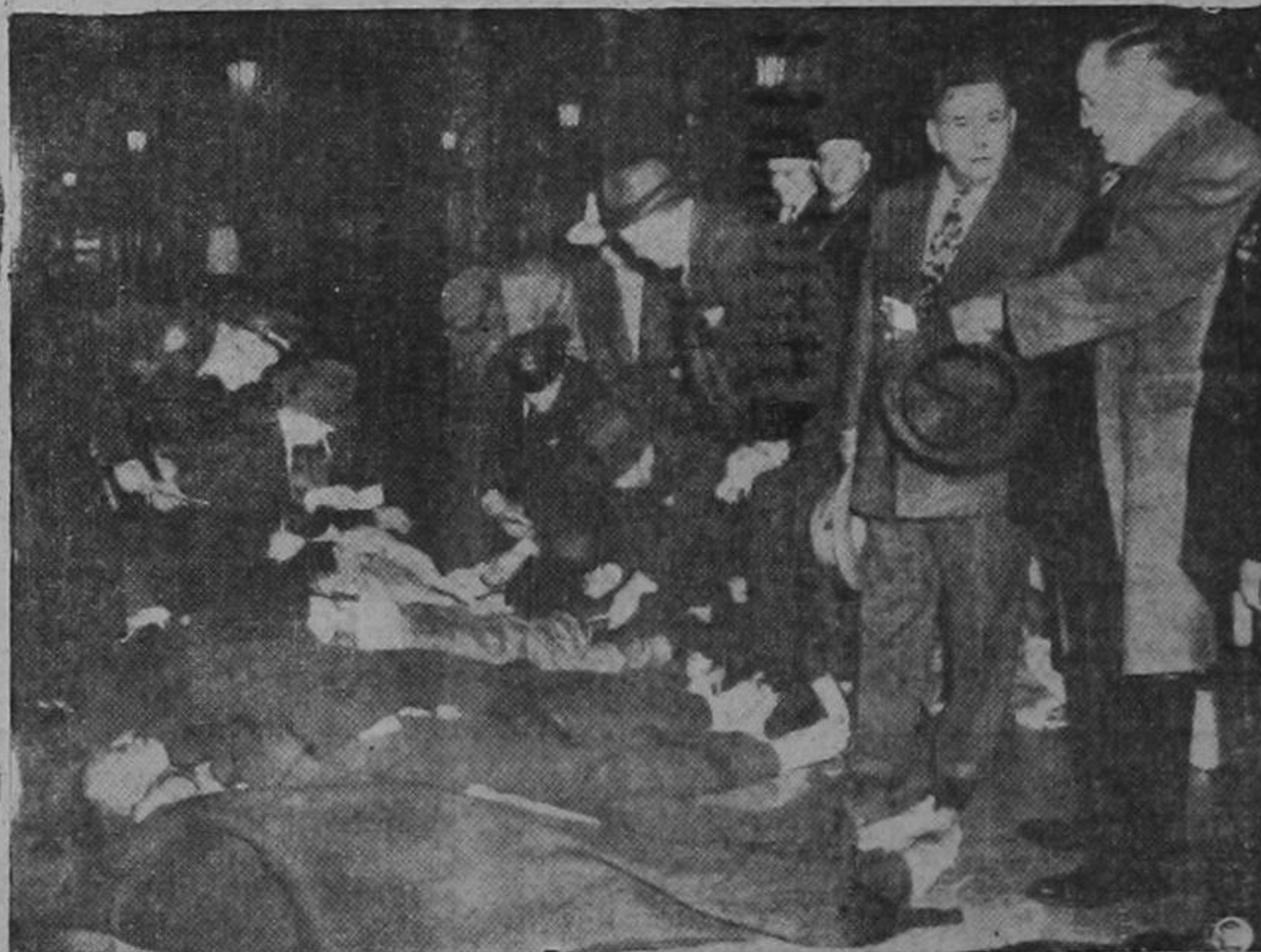
EN EL CITY HALL de Chicago se ha establecido temporalmente una morgue para identificar los cadáveres de las 56 personas que murieron quemadas unas y asfixiadas otras en el incendio del Hotel La Salle, de Chicago. Las autoridades supervisan la tarea de identificación.