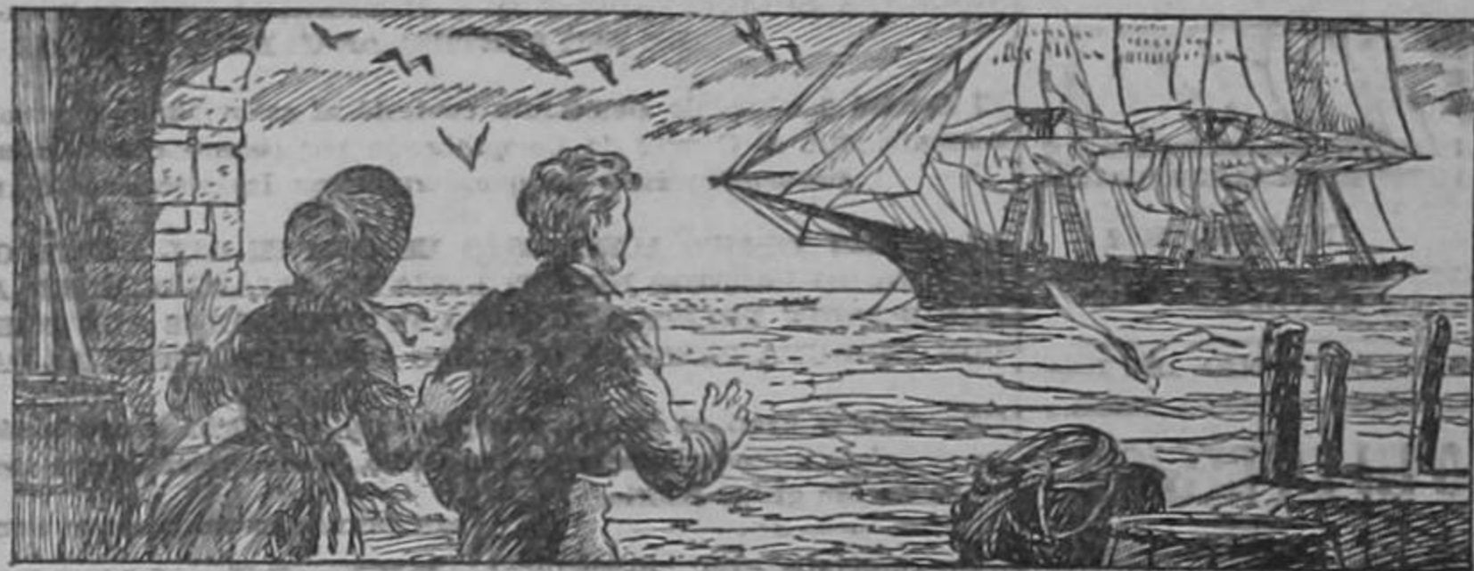
—¡Cáspita! — exclamó William. —¿Qué es eso? — Y contemplaron la gran nave.