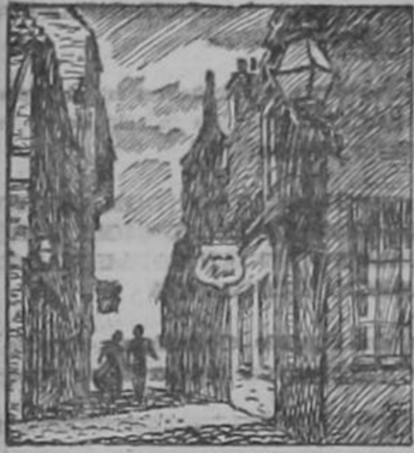
Danzaron sobre el empedrado.

Por: Elizabeth Goudge. Ilustraciones de: Lawrence Butcher.